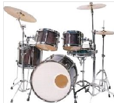
5 Ударные инструменты