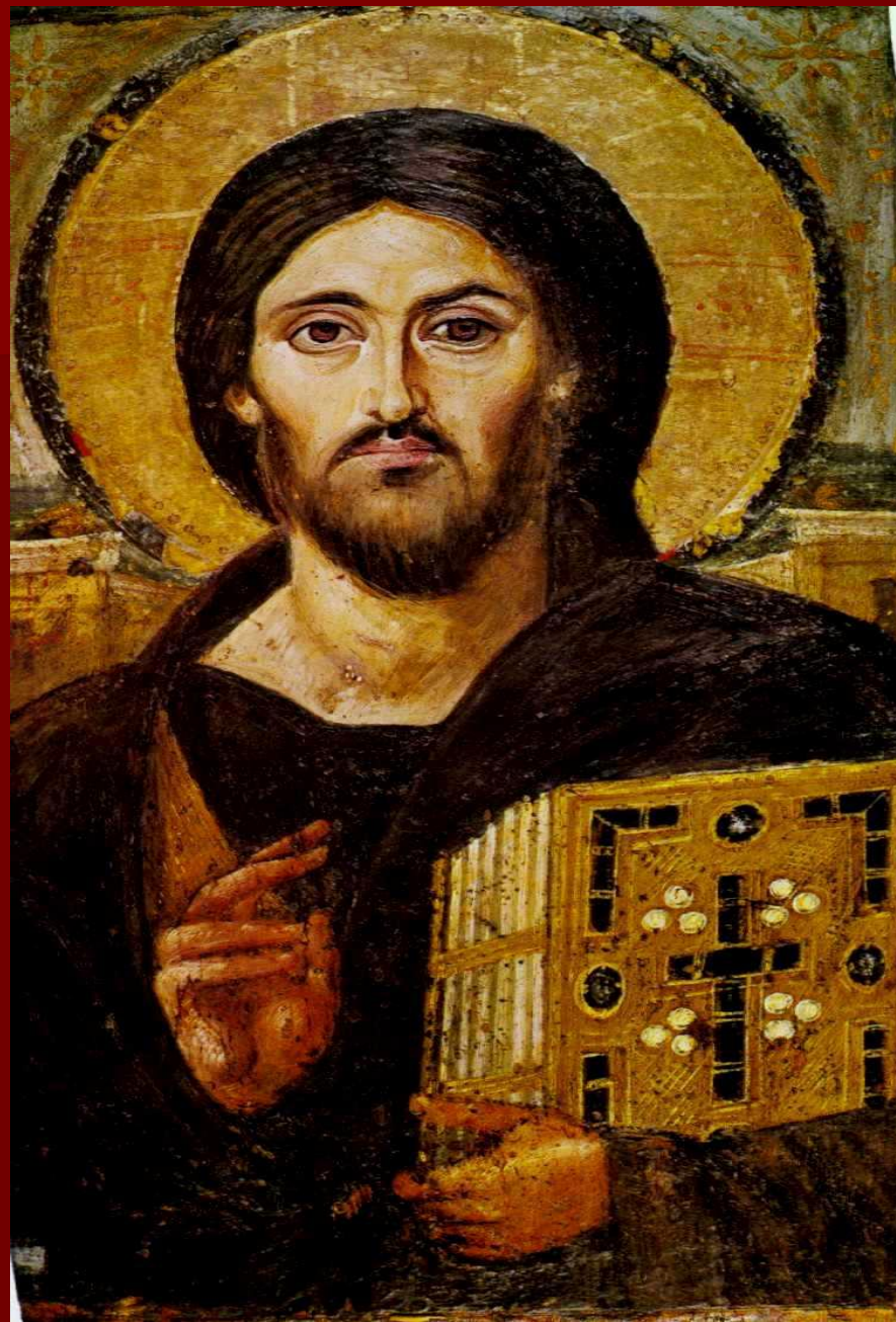
■ Христос Пантократор