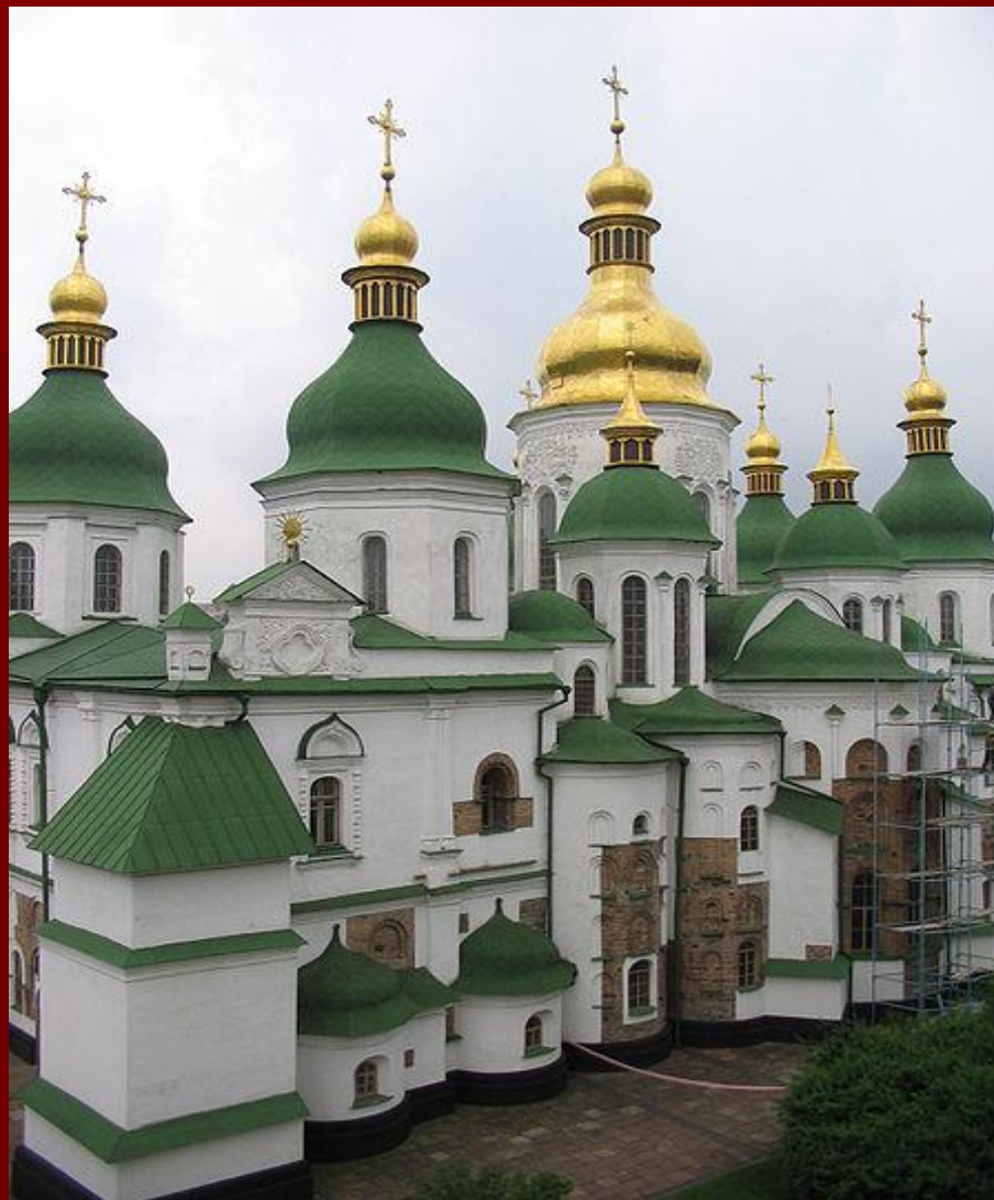
■ Софийский собор