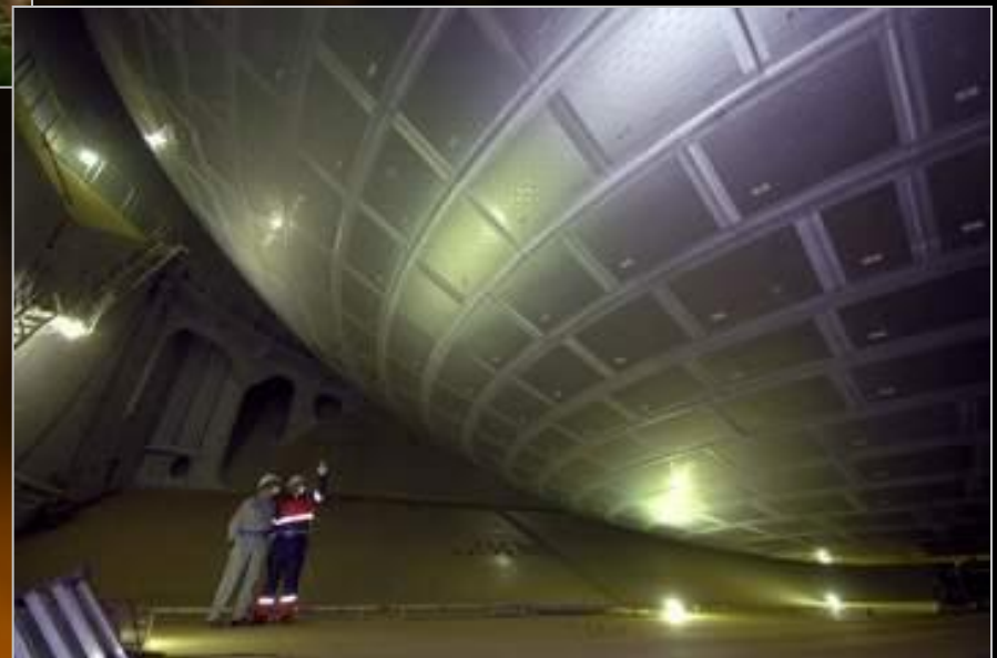
Внутри танкера по транспортировке СПГ