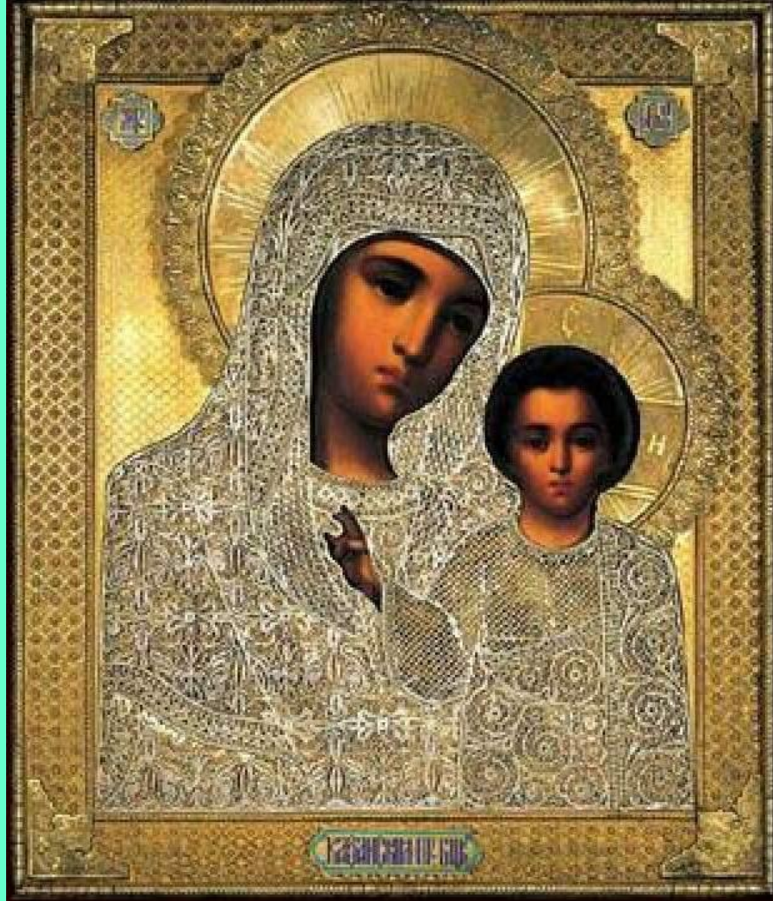
ИКОНА КАЗАНСКОЙ БОГОМАТЕРИ