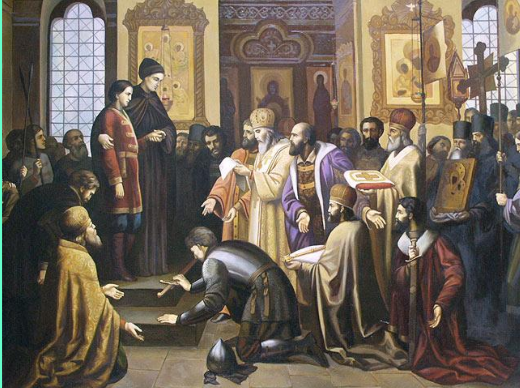
ИЗБРАНИЕ МИХАИЛА РОМАНОВА НА ЦАРСТВО