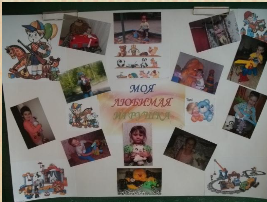
Фото выставка «Моя любимая игрушка»