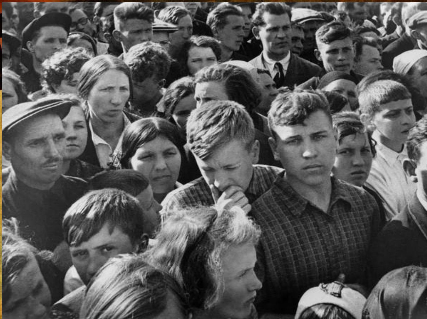
22 июня 1941 г. Москвичи слушают выступление В. Молотова по радио о нападении Германии на Советский Союз