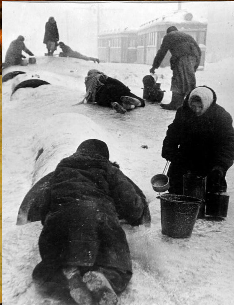
Всеволод Тарасевич Блокадный Ленинград, 1942