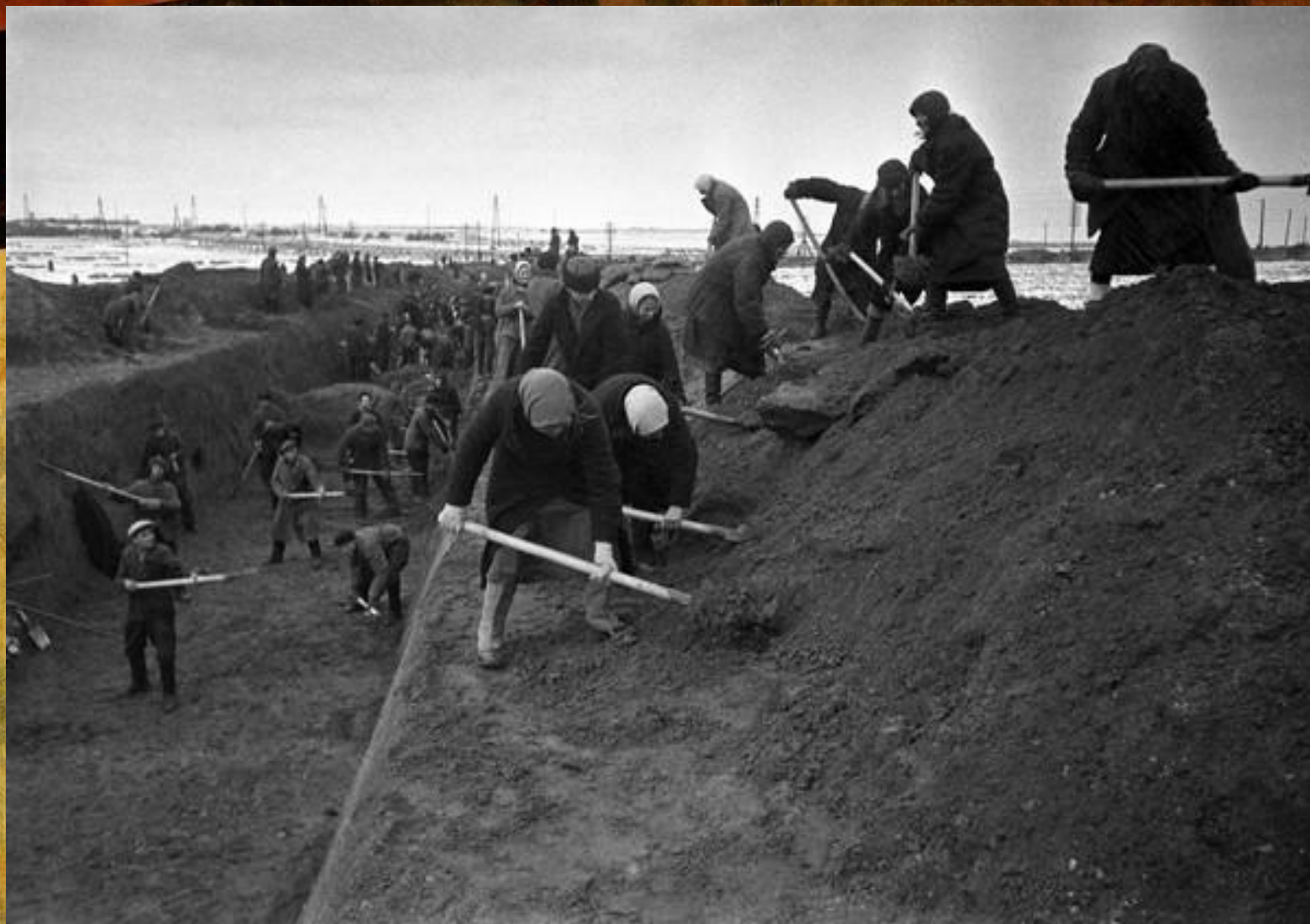
Александр Устинов. Оборона Москвы.