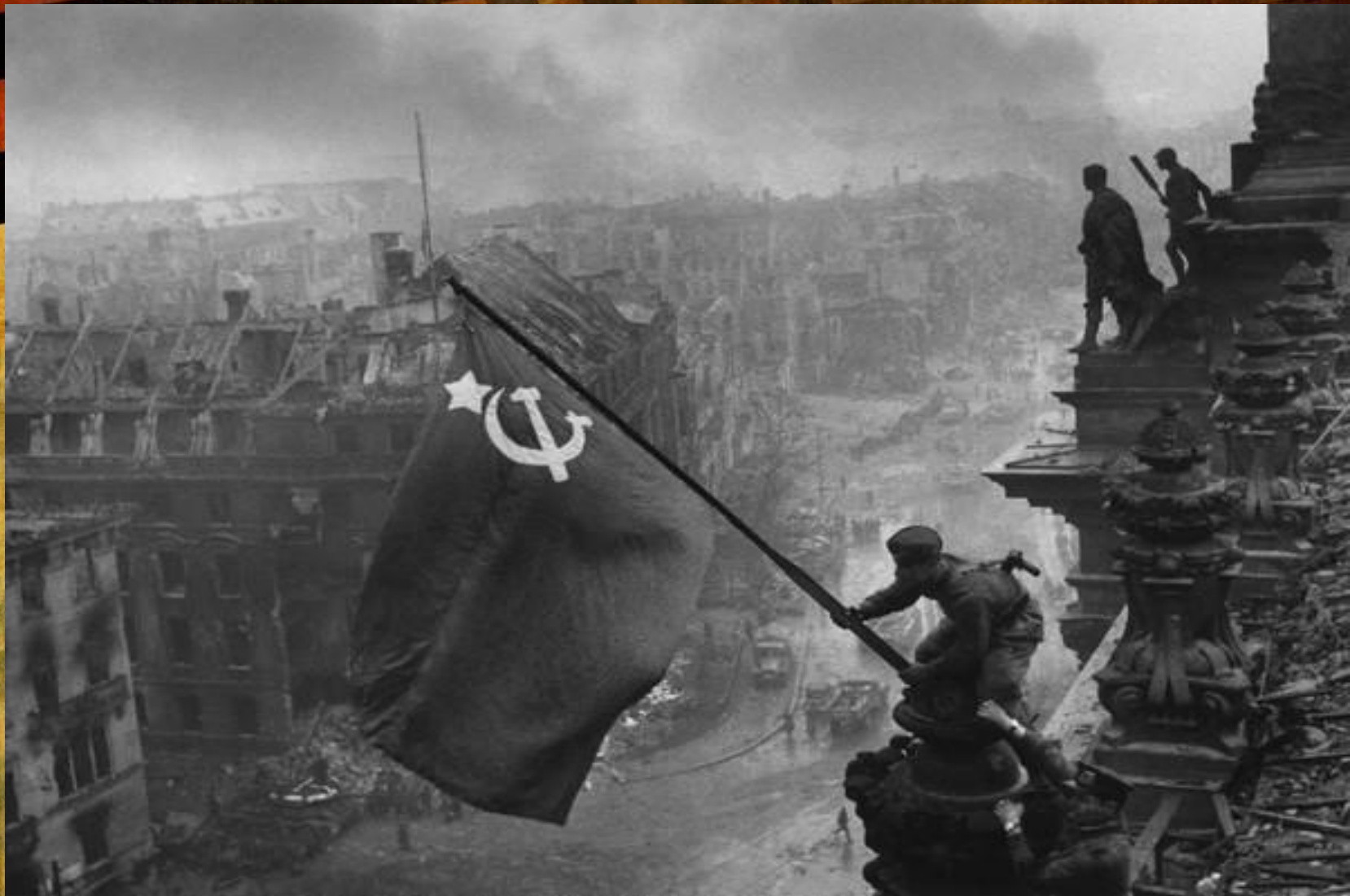
Евгений Халдей. Знамя Победы над рейхстагом. Берлин, май, 1945