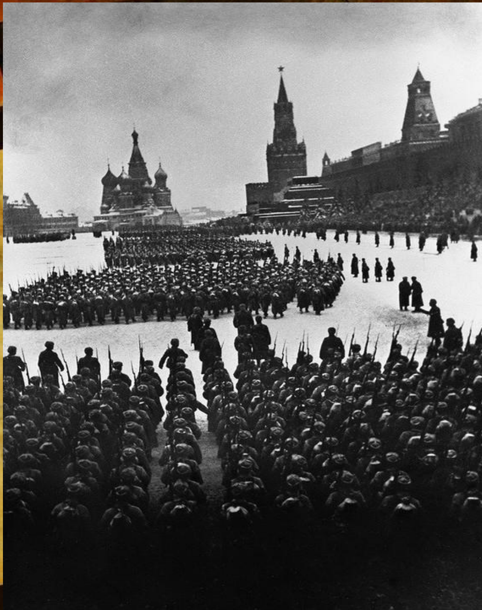
Аркадий Шайхет. На фронт. 1941