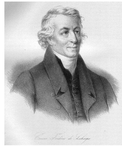
Вверху: Александр I Внизу: Екатерина II, Павел I, Фредерик Лагарп