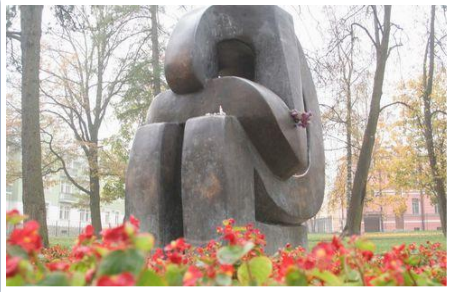
ПАМЯТНИК ПОГИБШИМ ВО ВТОРОЙ МИРОВОЙ ВОЙНЕ