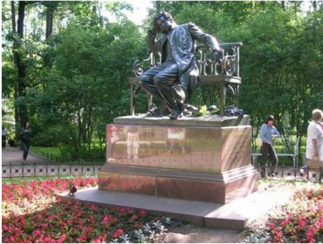
ПАМЯТНИК А.С. ПУШКИНУ В ЛИЦЕЙСКОМ САДУ