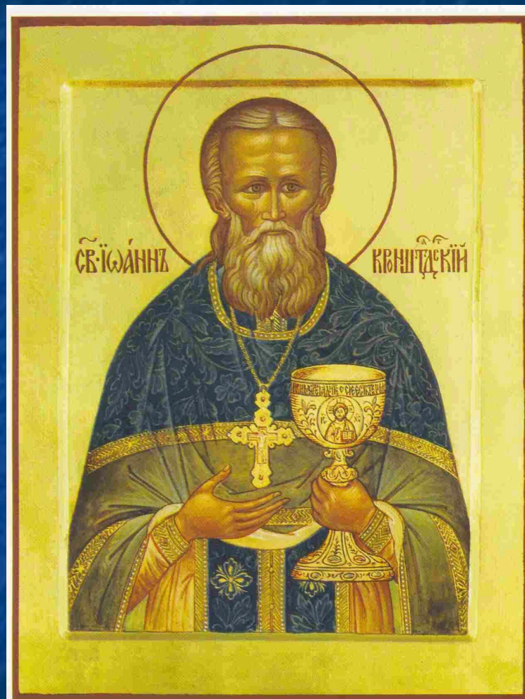
Праведный Иоанн Кронштадский