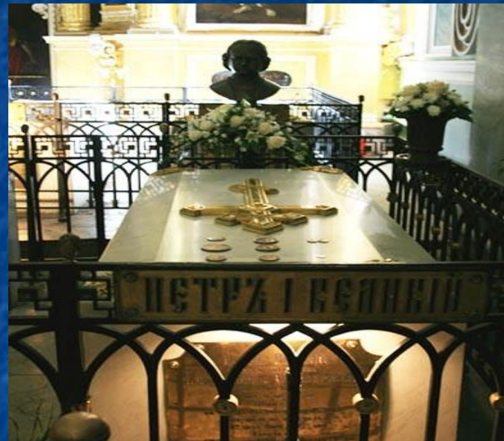
Надгробие над могилой Петра Первого