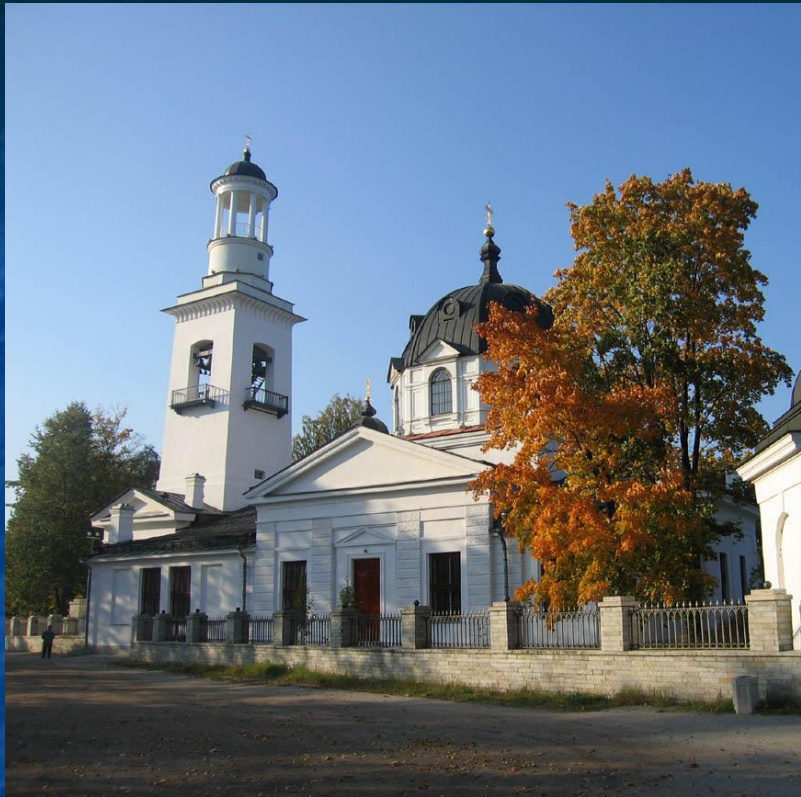
Церковь Александра Невского в Усть Ижоре