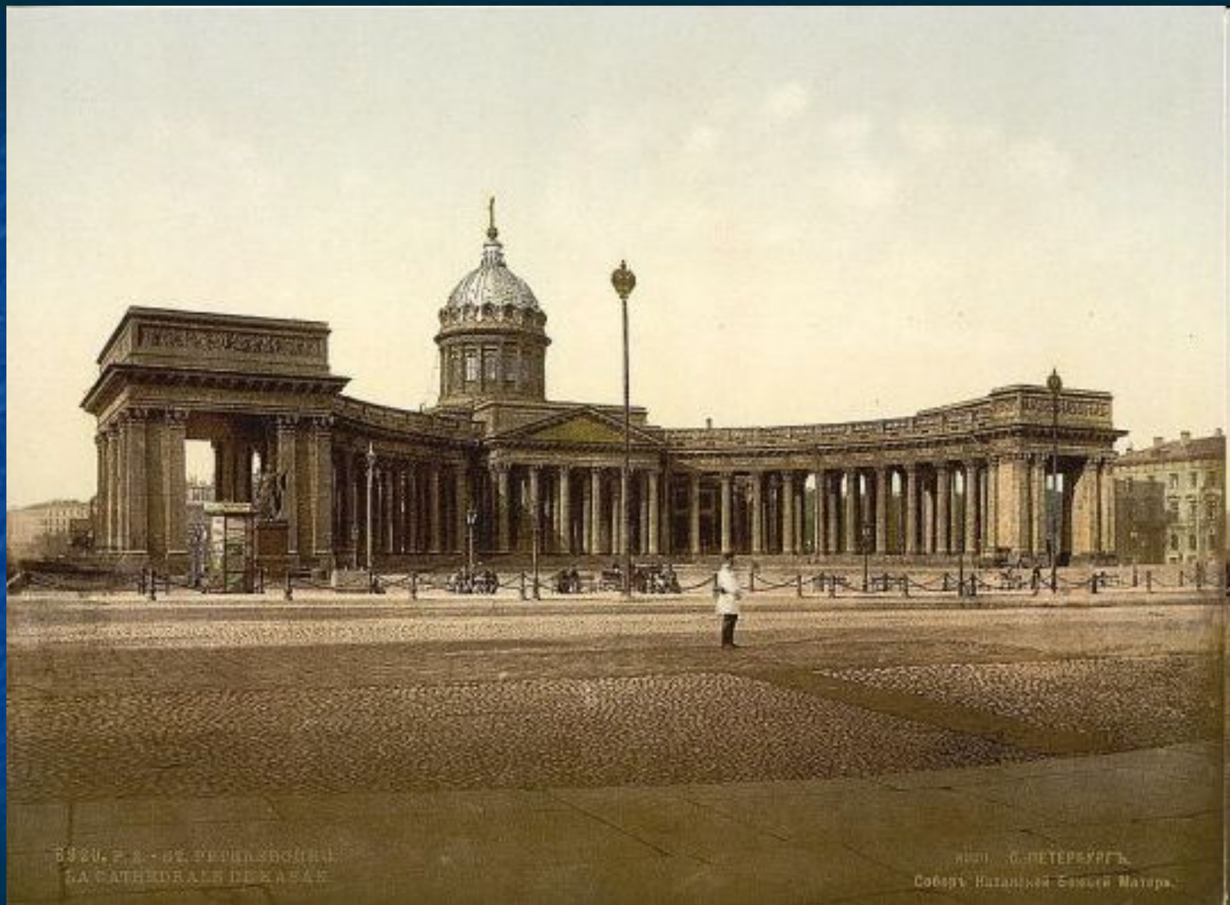
1850, F. J. DE REICHERDSONEN LA CATHEDRALE DE KAZAN