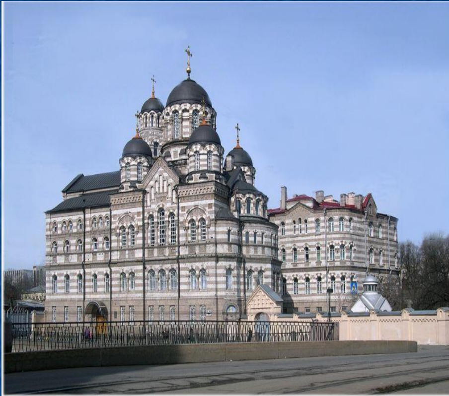
Памятник Иоанну в Кронштадте