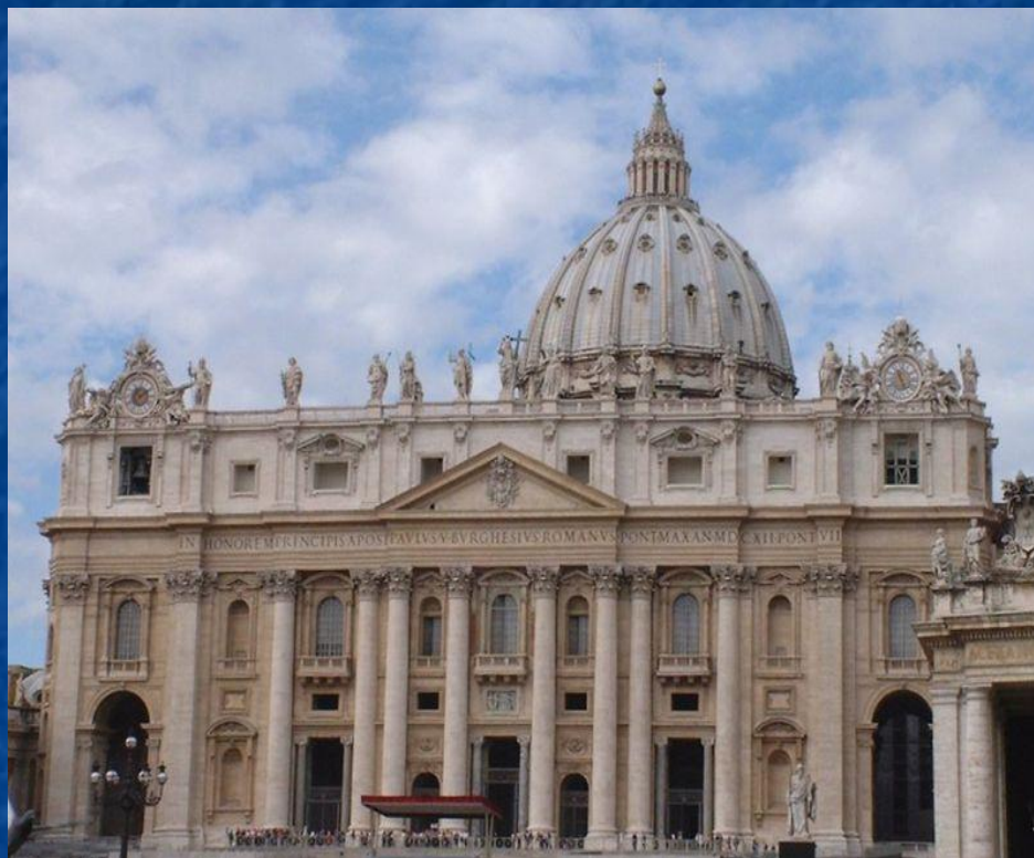
Собор Св. Петра в Риме