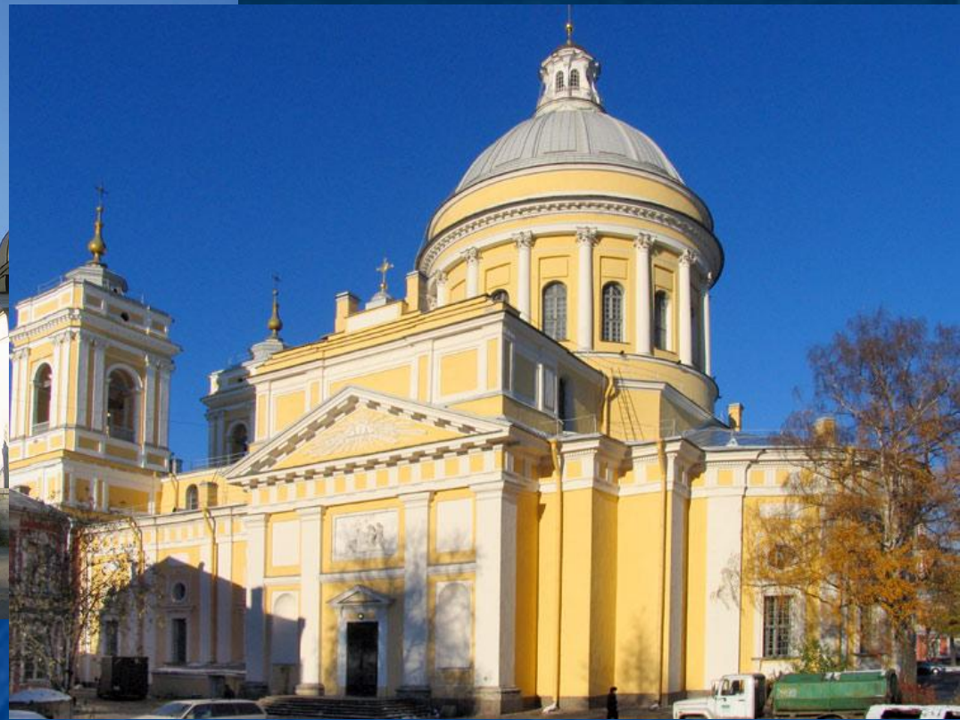
Свято - Троицкий собор в лавре