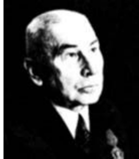
Леонид Владимирович Занков

Принципы: самостоятельность учащегося, творческое постижение материала . Учитель не выдаёт школьникам истины, а заставляет до них «докапываться» самим. Схема обратная традиционной: сначала даются примеры, а учащиеся сами должны сделать теоретические выводы . Усвоенный материал также закрепляется практическими заданиями. Новые дидактические принципы этой системы — это быстрое освоение материала, высокий уровень трудности, ведущая роль теоретических знаний. Постижение понятий должно происходить в понимании системных взаимосвязей.