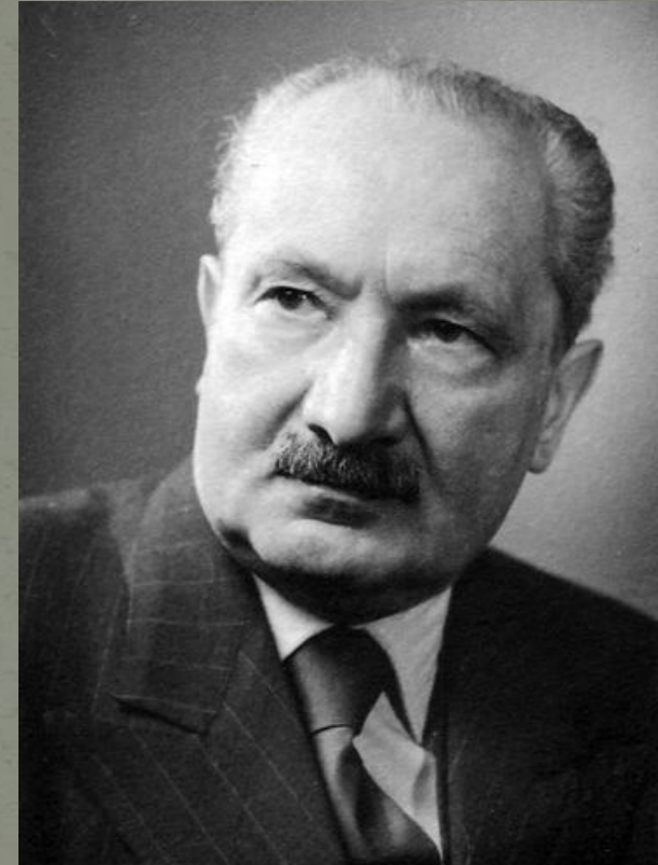
Немецкий философ (1889-1976)