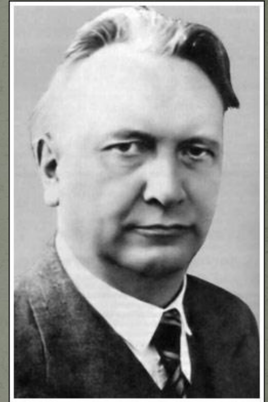
Немецкий философ (1883 – 1969)

◆ Однако в особых случаях истинная натура, данные скрытые качества выходят наружу. По Ясперсу, это пограничные ситуации – между жизнью и смертью, особо важные для человека, его дальнейшей судьбы. С этого момента человек осознает себя и становится самим собой, он соприкасается с трансцендентальностью – высшим бытием.