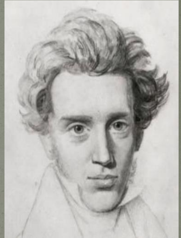
Датский философ (1813-1855)

➤ философия должна вернуться к человеку, помочь ему найти истину, понятную ему, ради которой он мог бы жить, помочь человеку сделать внутренний выбор и осознать свое «Я».