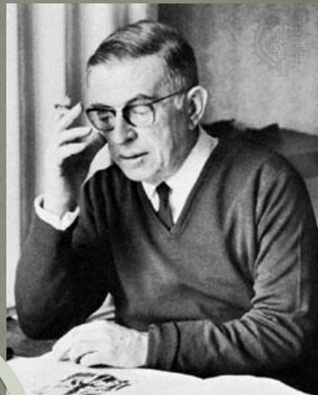
Французский философ (1905-1980)