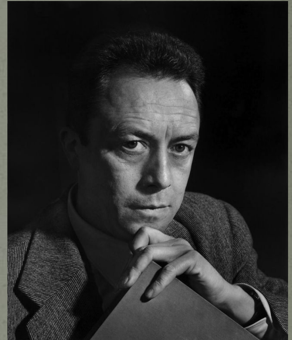
Французский мыслитель (1913-1960)

Те же, кто наполняют жизнь смыслом, рано или поздно понимают, что впереди (куда они изо всех сил идут) – смерть, Ничто. Смертны все – и наполняющие жизнь смыслом, и не наполняющие.