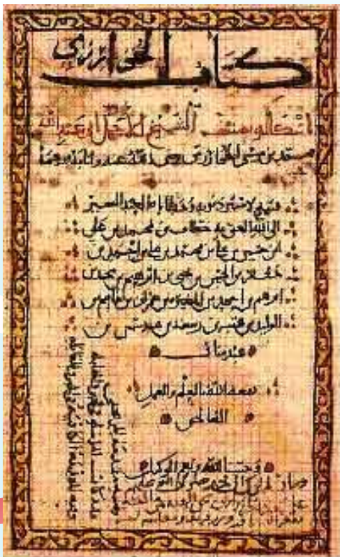
A page from the Kitab al-jabr wa'l-muqabala . (Earp, J.L., editor, Oxford History of Islam . Oxford University Press, Oxford, 1999)

Позднее при переводе на латинский язык арабское название трактата было сохранено. С течением времени «аль-джебр» сократили до «алгебры».