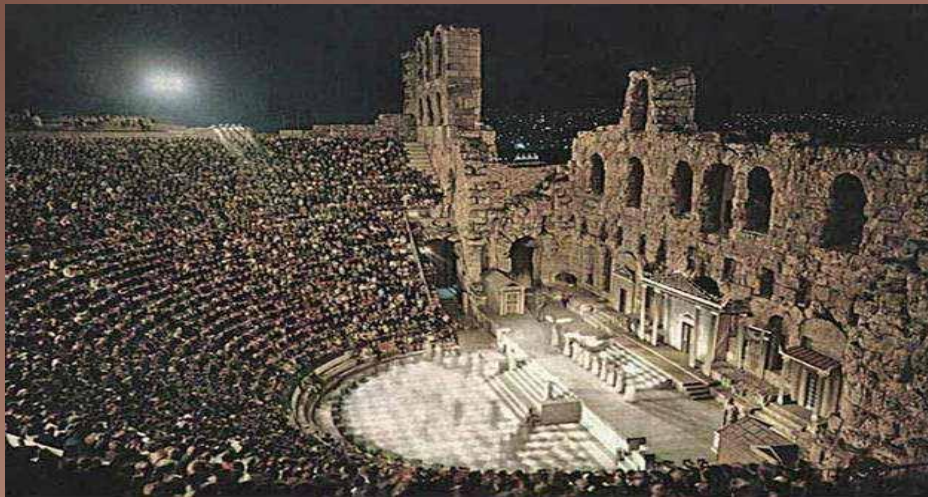
Театр Древней Греции

Из обрядовых песен, которые пели, облачаясь в козлиные шкуры, родилась трагедия (трагос - козёл, ода - песня); из озорных и весёлых песен родилась комедия.