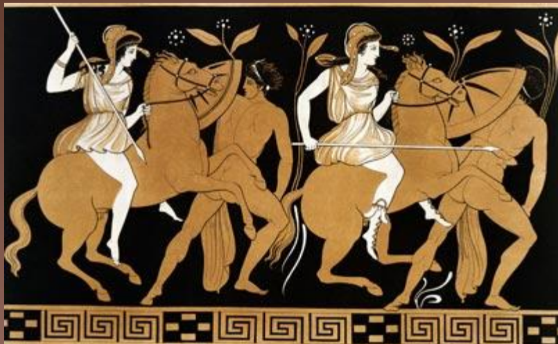
Древнегреческая живопись . Чернофигурные вазы