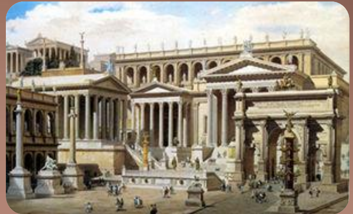
Идеальная реконструкция Римского форума

с XI-IX вв. до н.э., времени становления античного общества в Греции и до V вв. н.э. - гибели римской империи под ударами варваров.