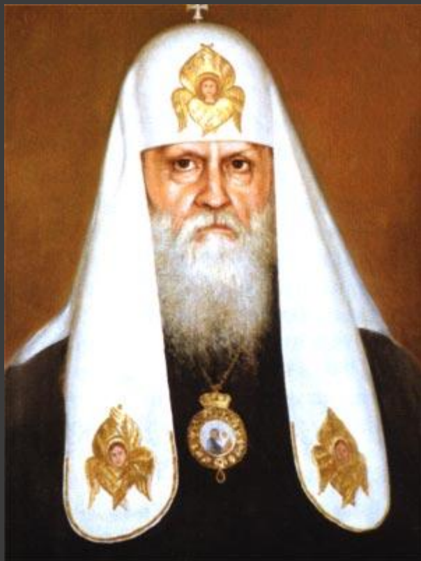
Патриарх Московский и всея Руси Пимен (Извеков)