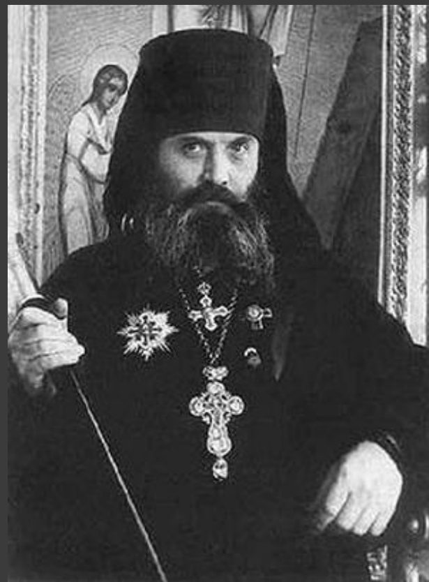
Архимандрит Алипий (Воронов)