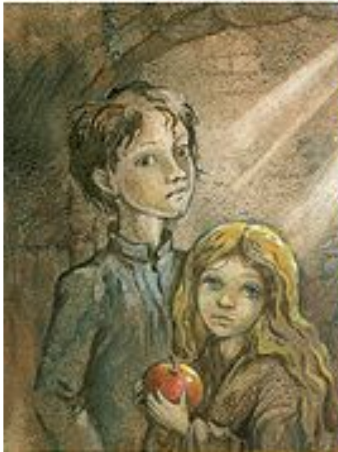
Валек и Маруся

В повести противопоставляются Маруся и Соня. Такое противопоставление называется антитезой. Маруся — худенькая маленькая девочка четырех лет.