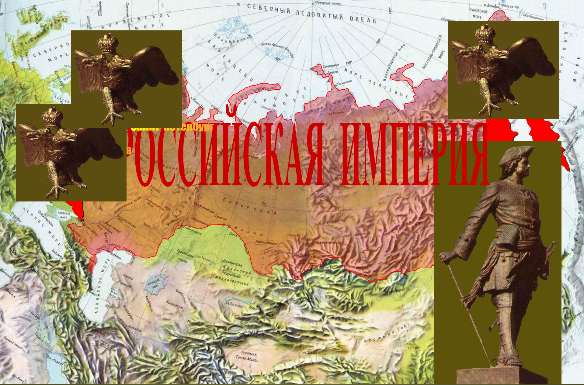
РОССИЯ ПРИ ПЕТРЕ ВЕЛИКОМ