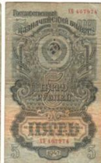
Денежные знаки образца 1947 года