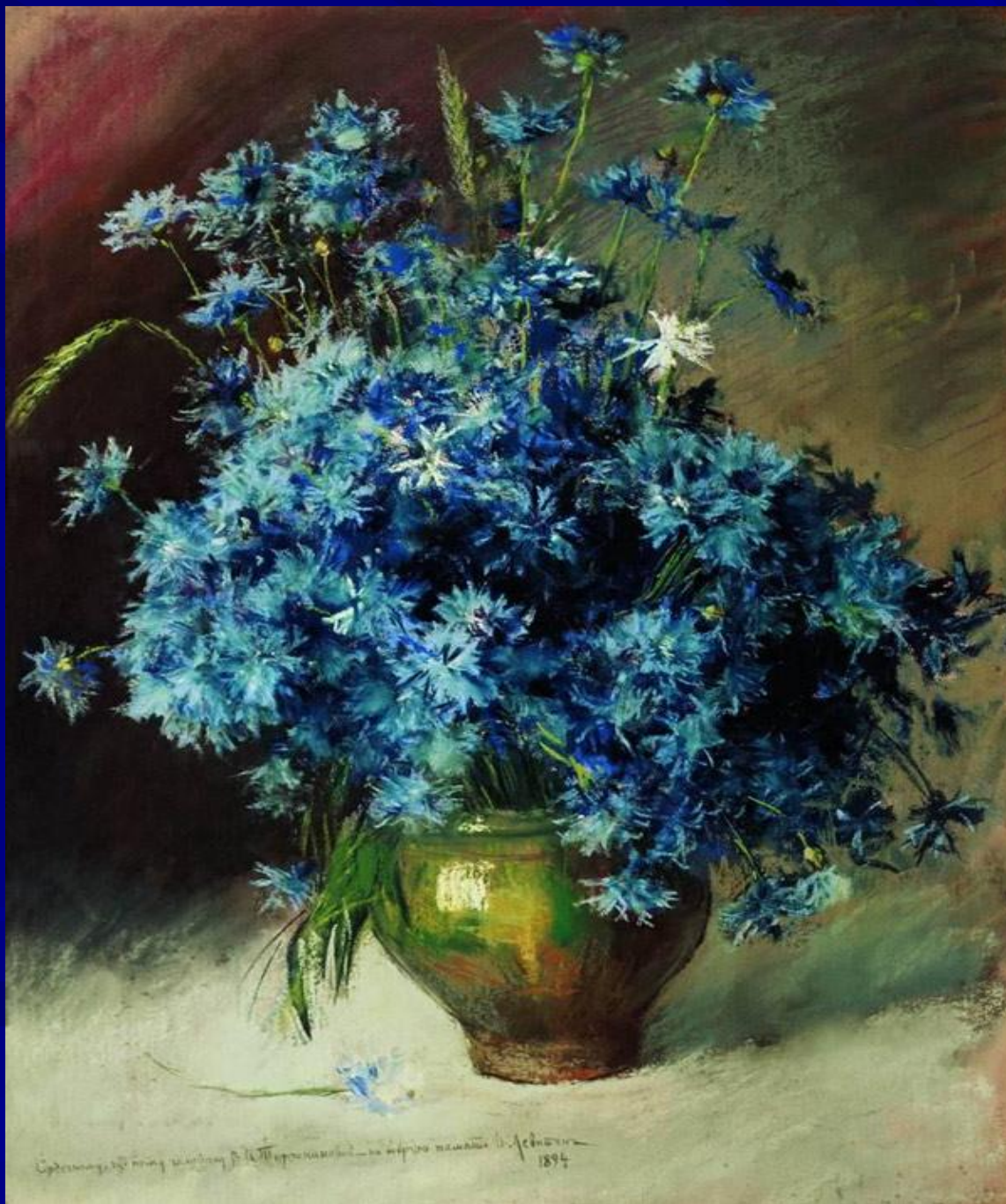
Исаак Ильич Левитан «Васильки» (1894)