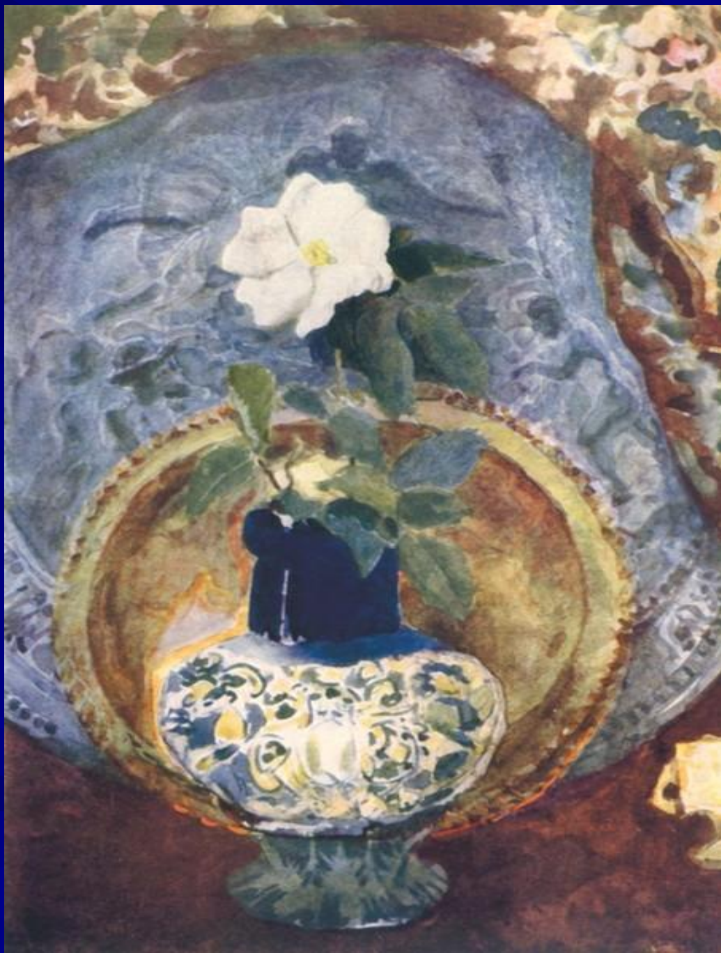
Михаил Александрович Врубель «Шиповник» (1884)