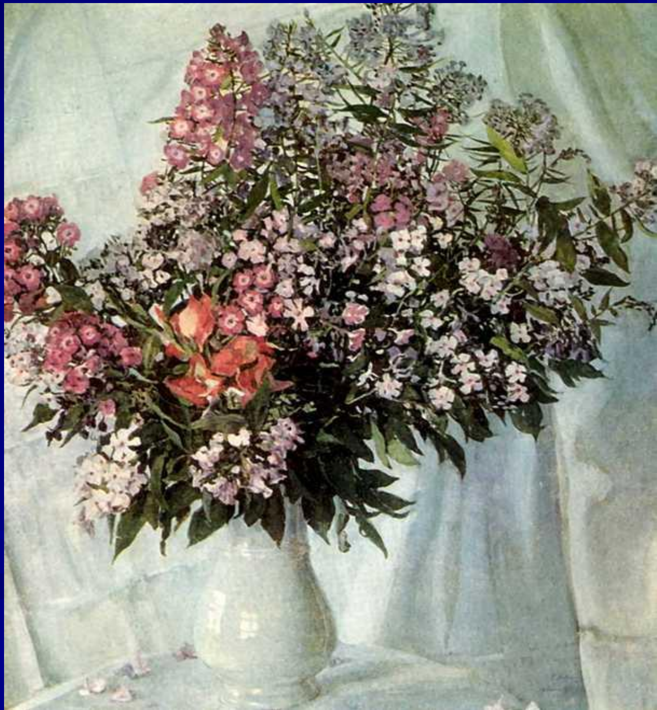
Александр Яковлевич Головин «Флоксы» (1911)