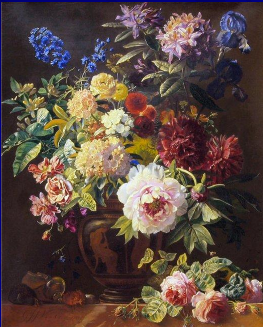
Георг Якоб Йоганн ван Ос (нидерл., ок.1860)