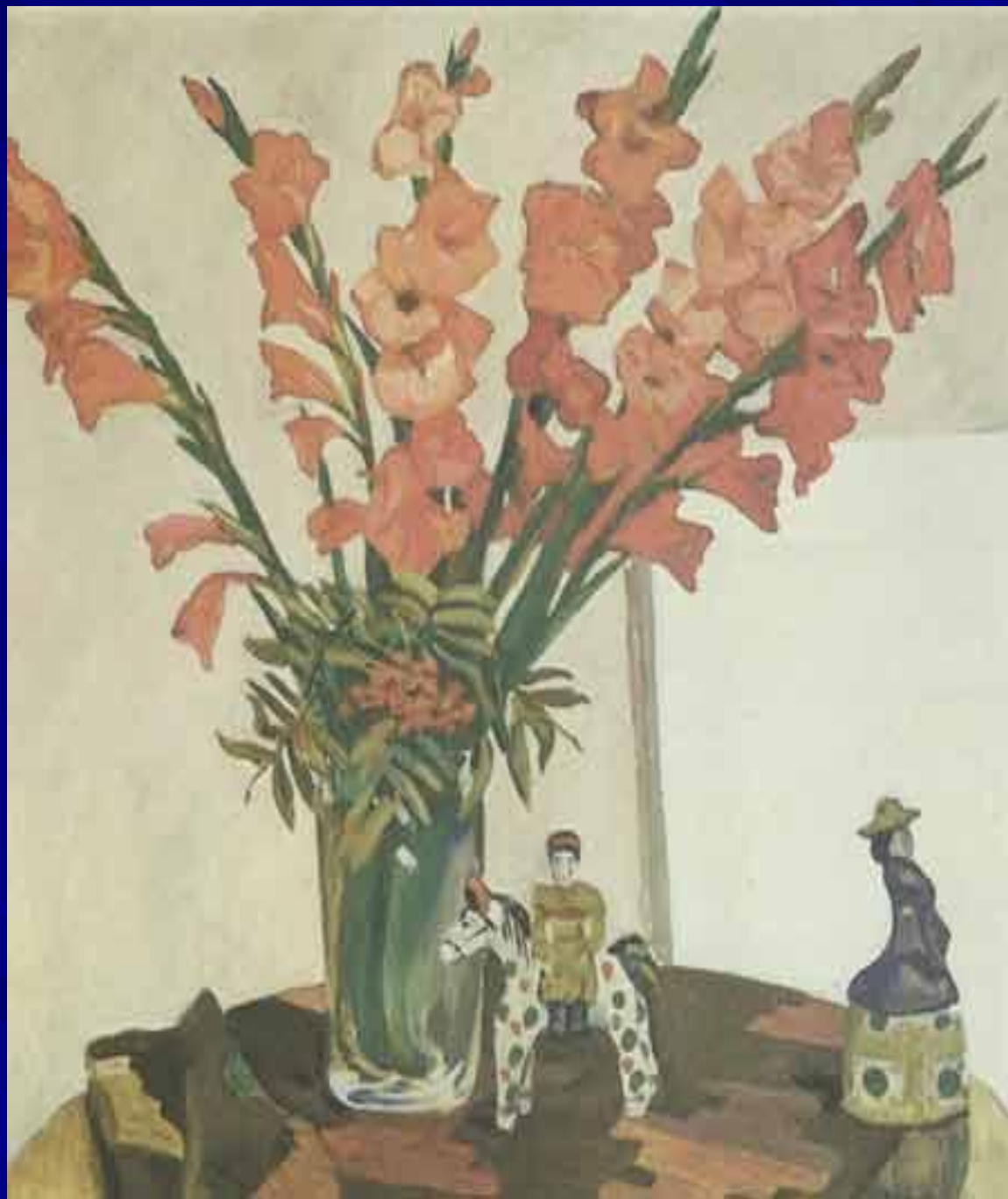
Александр Александрович ч Дейнека «Гладиолусы с рябиной» (1949)