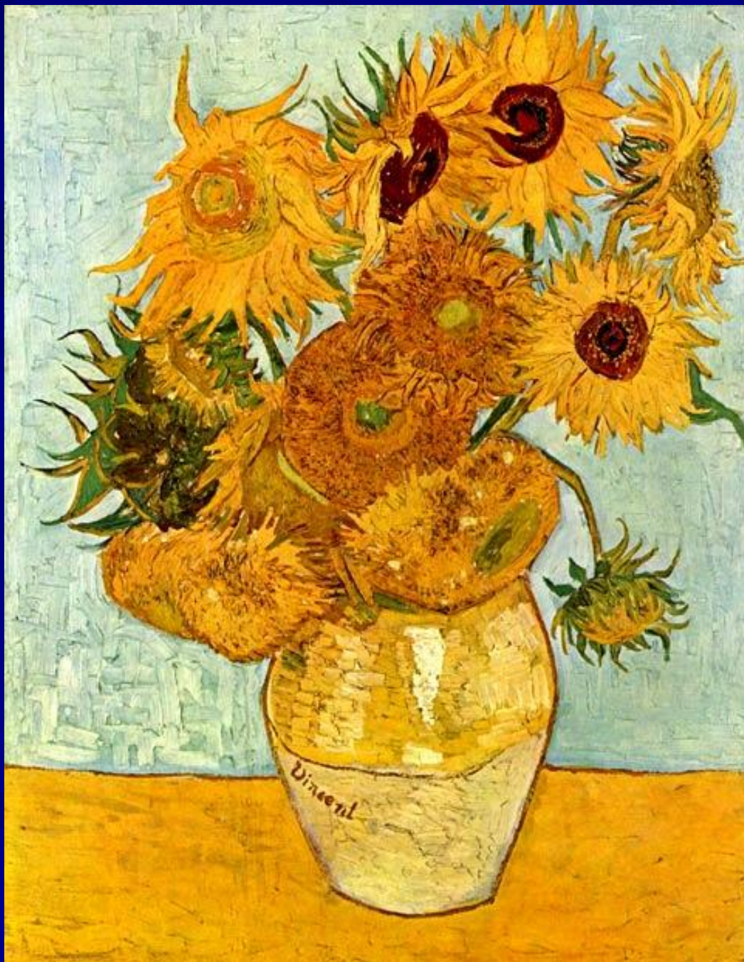
Винсент Ван Гог «Подсолнухи» (нидерл., 1889)