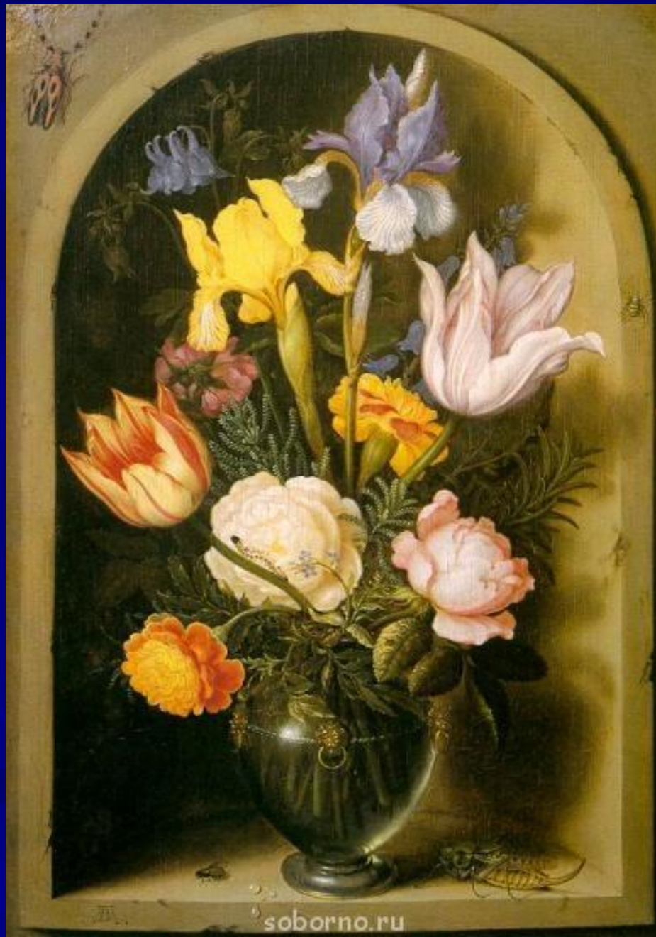
Амброзиус Босхарт Старший (фламанд., ок.1621)