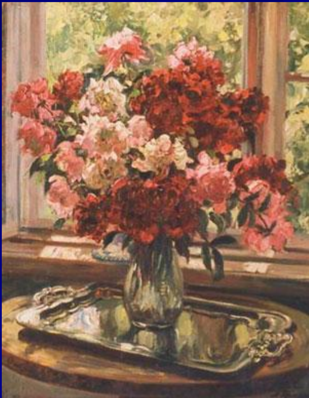
Александр Михайлович Герасимов «Пионы» (1958)