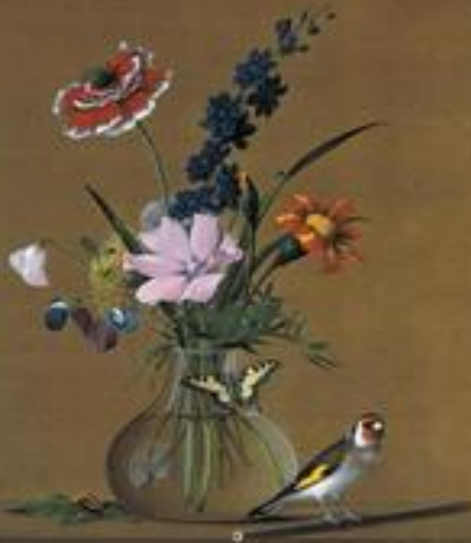
Федор Петрович Толстой «Букет цветов, бабочка и птичка» (1820)