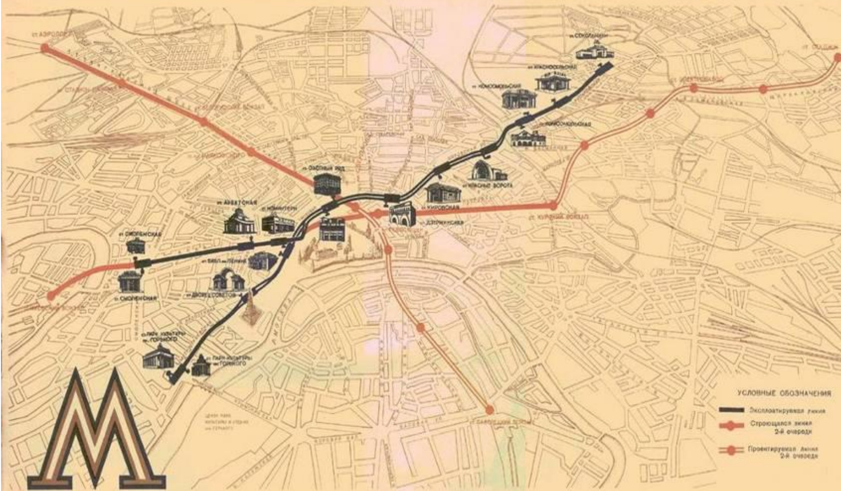
СХЕМА ЛИНИЙ МОСКОВСКОГО МЕТРОПОЛИТЕНА ИМЕНИ Л. М. НАГАНОВИЧА 1-й и 2-й ОЧЕРЕДЕЙ

Генеральный план реконструкции города Москвы