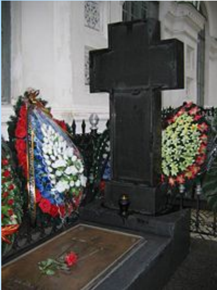
Могила Столыпина (Киево-Печерская лавра)

Последующие дни прошли в тревоге, врачи надеялись на выздоровление, но 4 сентября вечером состояние Столыпина резко ухудшилось, и около 10 часов вечера 5 сентября он скончался. В первых строках вскрытого завещания Столыпина было написано: «Я хочу быть погребённым там, где меня убьют» . Указание Столыпина было исполнено: 9 сентября Столыпин похоронен в Киево-Печерской лавре.