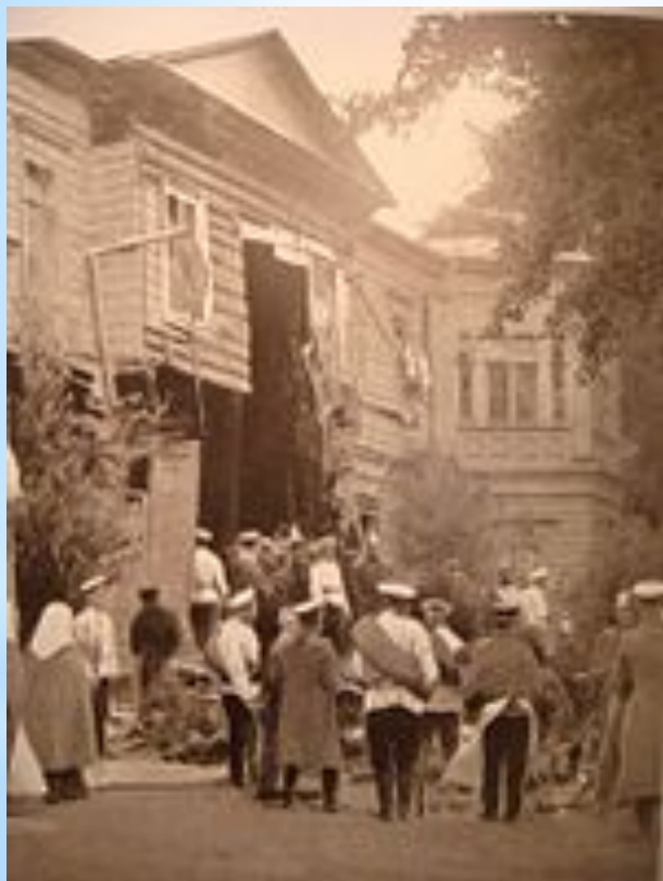
Взрыв на Аптекарском острове (Санкт-Петербург)

За короткий промежуток времени с 1905 по 1911 годы на Столыпина планировалось и было совершено 11 покушений, последнее из которых достигло своей цели.