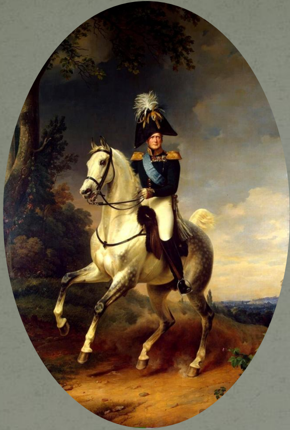
Александр I (1777-1825)