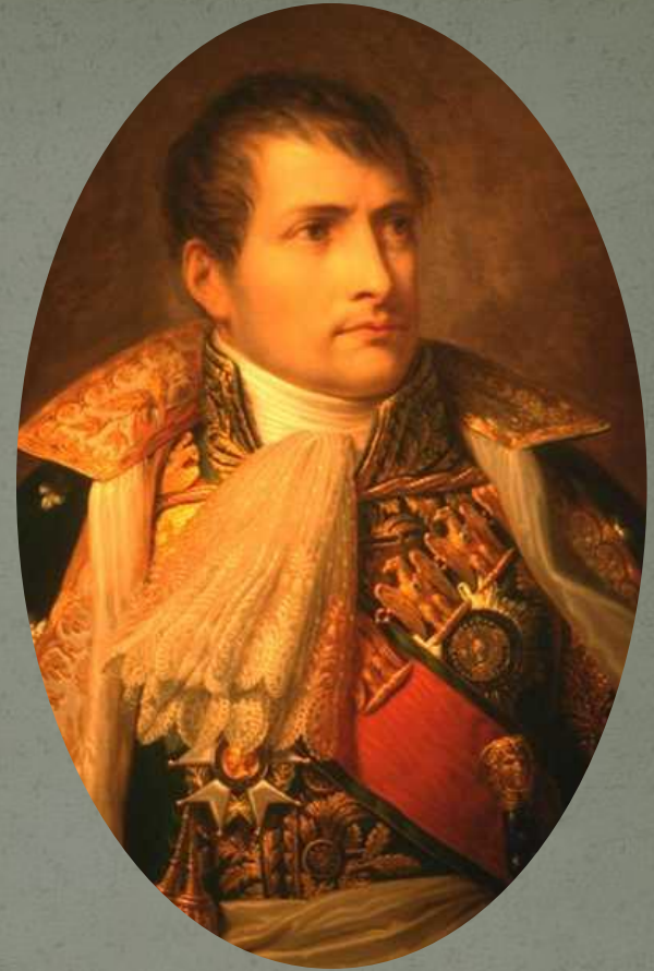
Наполеон Бонапарт (1769-1821)