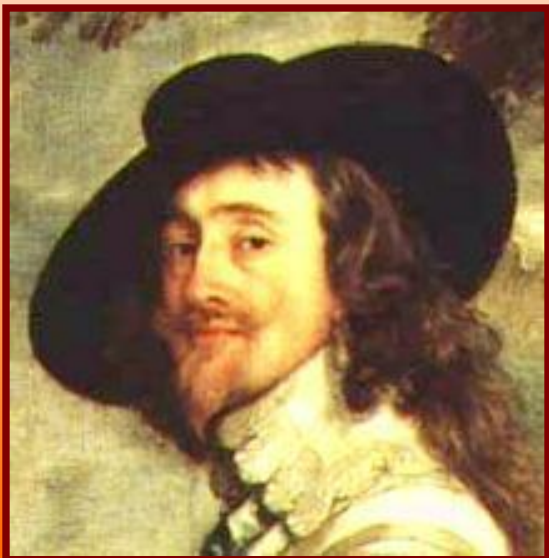
Карл I Стюарт

В 1625 г. королем стал Карл I. Он продолжал политику отца. Король был самолюбив, вспыльчив, неуравновешен и лицемерен. Карл I женился на католичке – французской принцессе Генриетте Марии и при дворе было введено католическое богослужение.