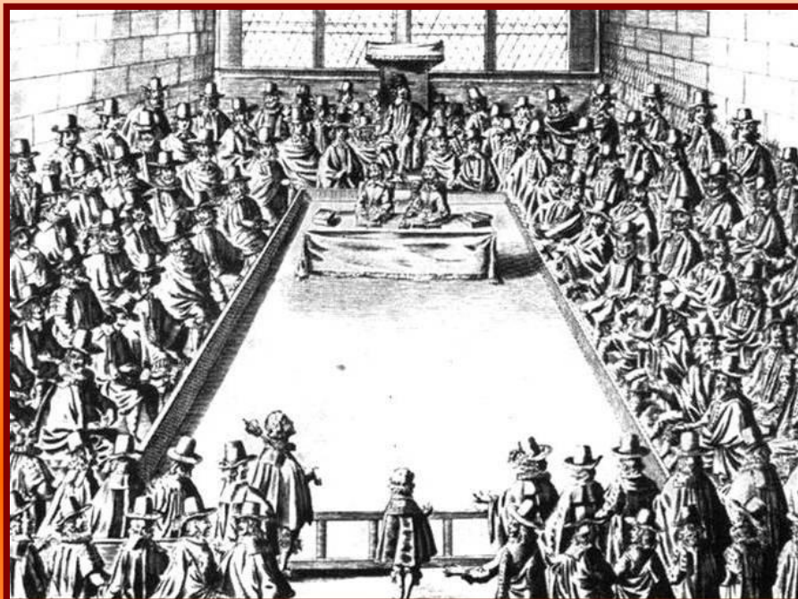
Заседание Долгого парламента. Гравюра 17 в.

Карл I обвинил вождей парламентской оппозиции в государственной измене и потребовал суда над ними.