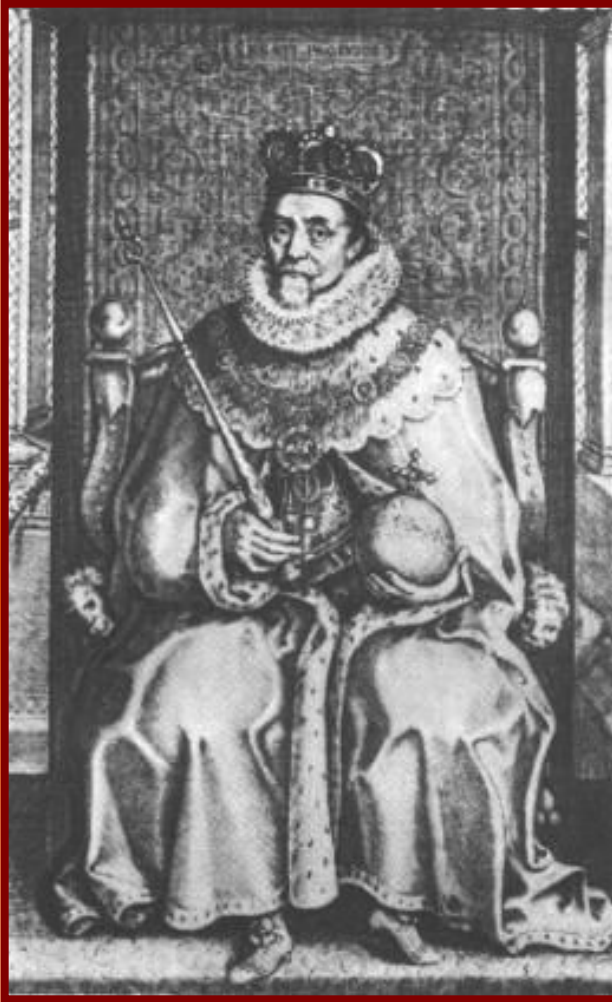
Яков I Стюарт

Король Яков I Стюарт стремился править единолично, не спрашивая мнения парламента. Он защищал англиканскую церковь и притеснял пуритан, вынужденных массово переселяться в Америку.