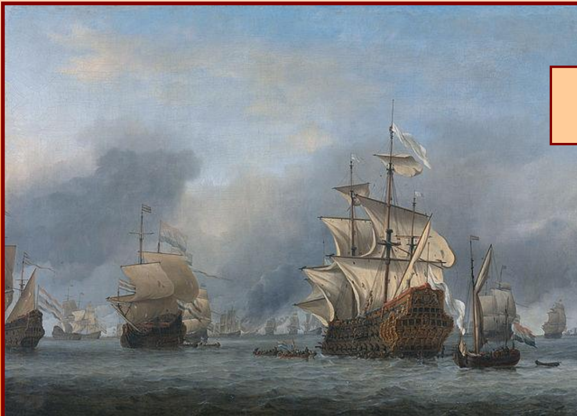
Английские корабли 17 в.

В конце XVI в. в Англии быстрыми темпами развивалась промышленность, страна превратилась в сильную морскую державу, в Америке была основана первая колония – Виргиния. Многие джентри (новые дворяне) и купцы по своему богатству могли соперничать с лордами.