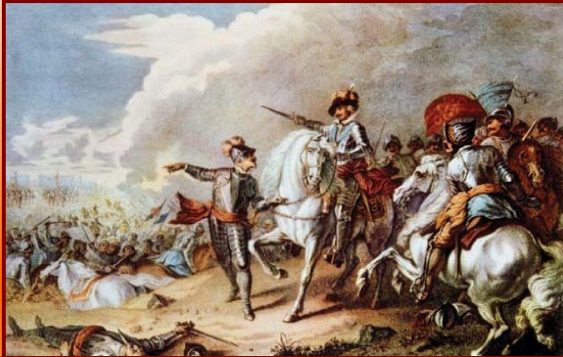
Битва при Нейсби

В июне 1645 г. армия парламента нанесла поражение армии короля в битве при Нейсби.