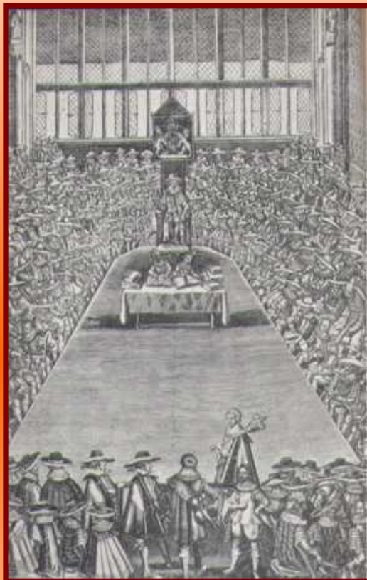
Английский парламента 17 в.

Парламент, в котором большинство составляли пуритане, принял важные реформы: