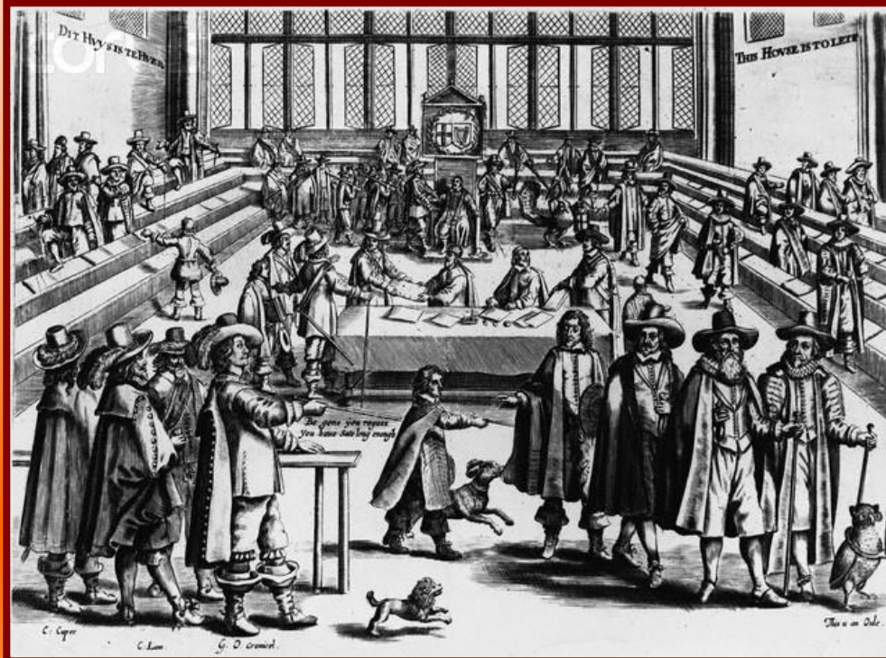
Пресвитериане в английском парламенте

Парламент стремился к компромиссу с королем – он должен был признать все проведенные реформы и господство пуританской церкви. Но пуритане, служившие в армии, были настроены более решительно – они требовали свободы вероисповедания и ограничения власти короля.