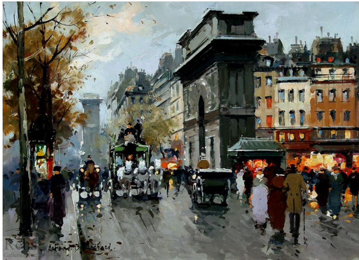
Осенний закат в Париже.