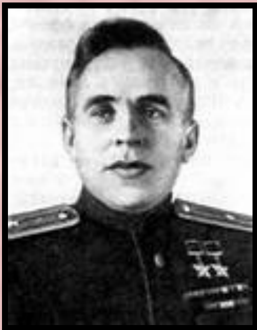
Александр Шабалин – командир торпедного катера. Дважды Герой Советского Союза