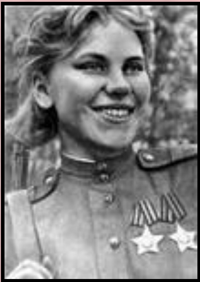
Роза Шанина, снайпер