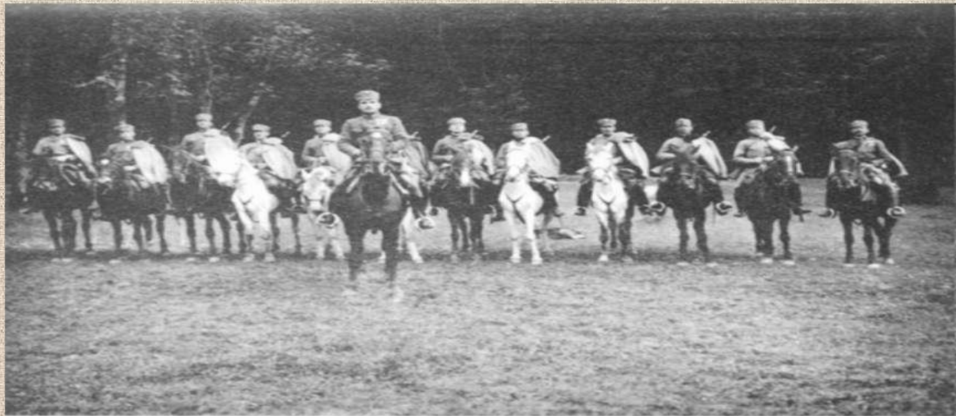
З/16. Відділ кінноти УСС (на передньому плані пор. Р. Камінський). Поділля, 1916р.