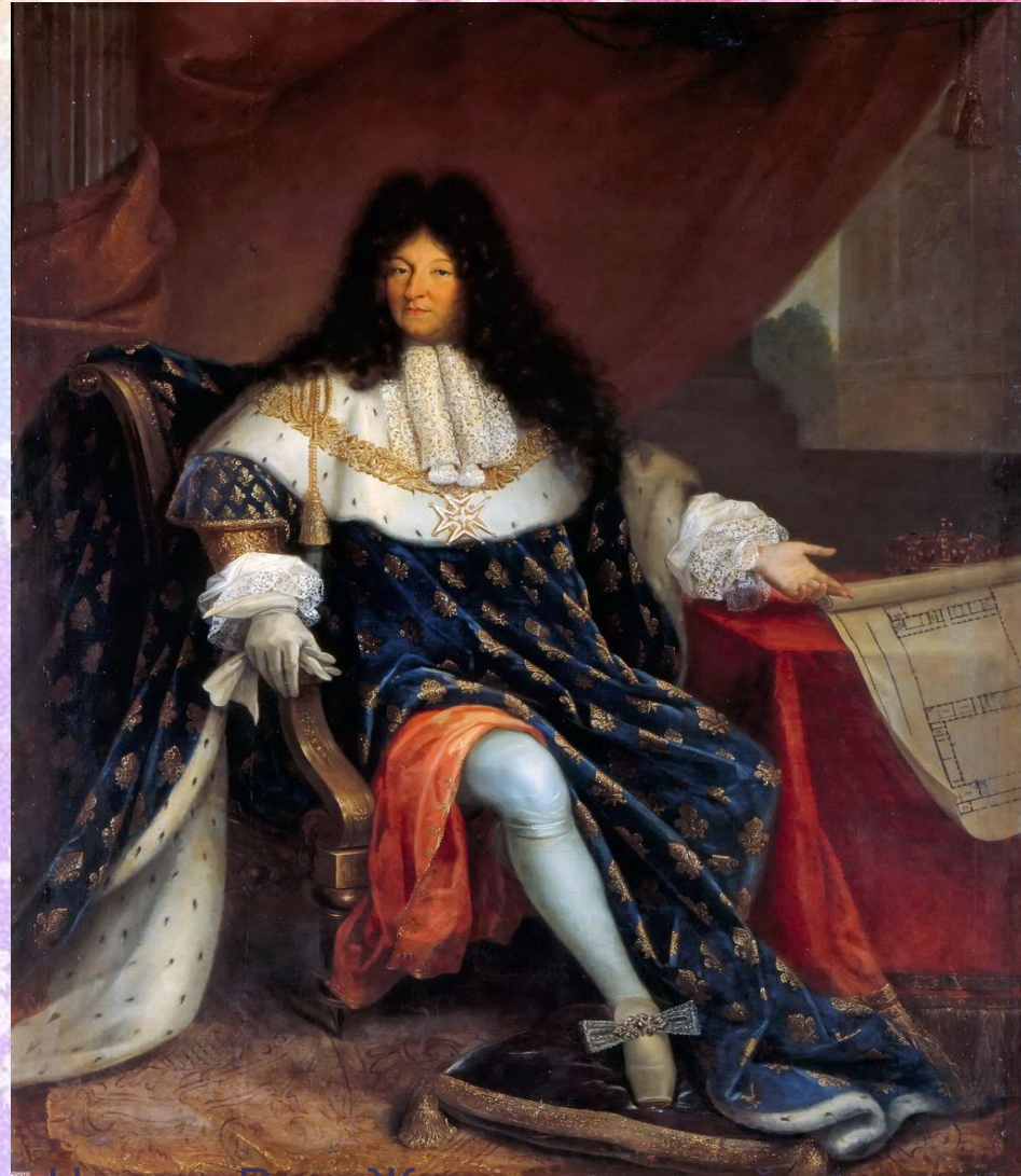
Николя-Рене Жоллен старший - Людовик XIV с планом поместья св Людовика в Сен-Сир

Конец XVII века во Франции стал эталоном роскоши, которая считалась хорошим тоном, а все остальное