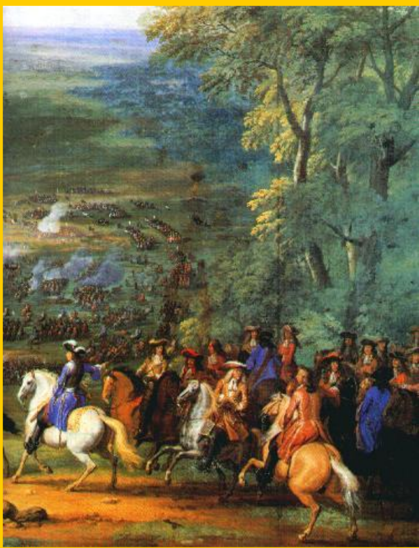
Принц Конде в битве при Рокруа.

Вскоре в Германию вторглись шведы и в 1632 г. Густав Адольф II разбил католиков, но сам погиб. В 1634 г. Валленштейн был убит заговорщиками. Вскоре, в войну вмешалась Франция. Ришелье оказал немецким князьям финансовую помощь. В 1642-46 гг. союзники одержали ряд побед над австрийцами и испанцами, и 24 октября 1648 г. в Мюнстере был подписан Вестфальский мир.