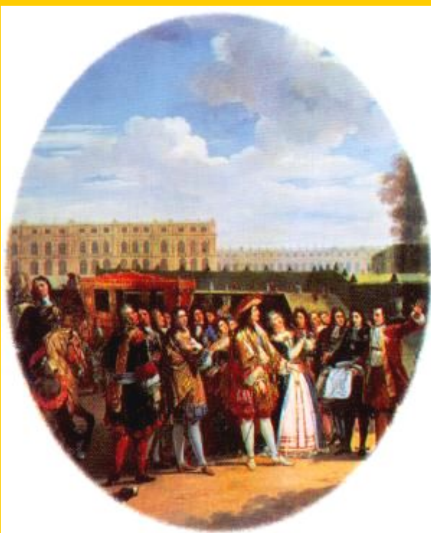
Людовик XIV осматривает Версаль

По окончании войны самыми могущественными государствами стали Швеция и Франция. Французскому королю подражали все европейские монархи. Версаль стал образцом дворцово-паркового зодчества.