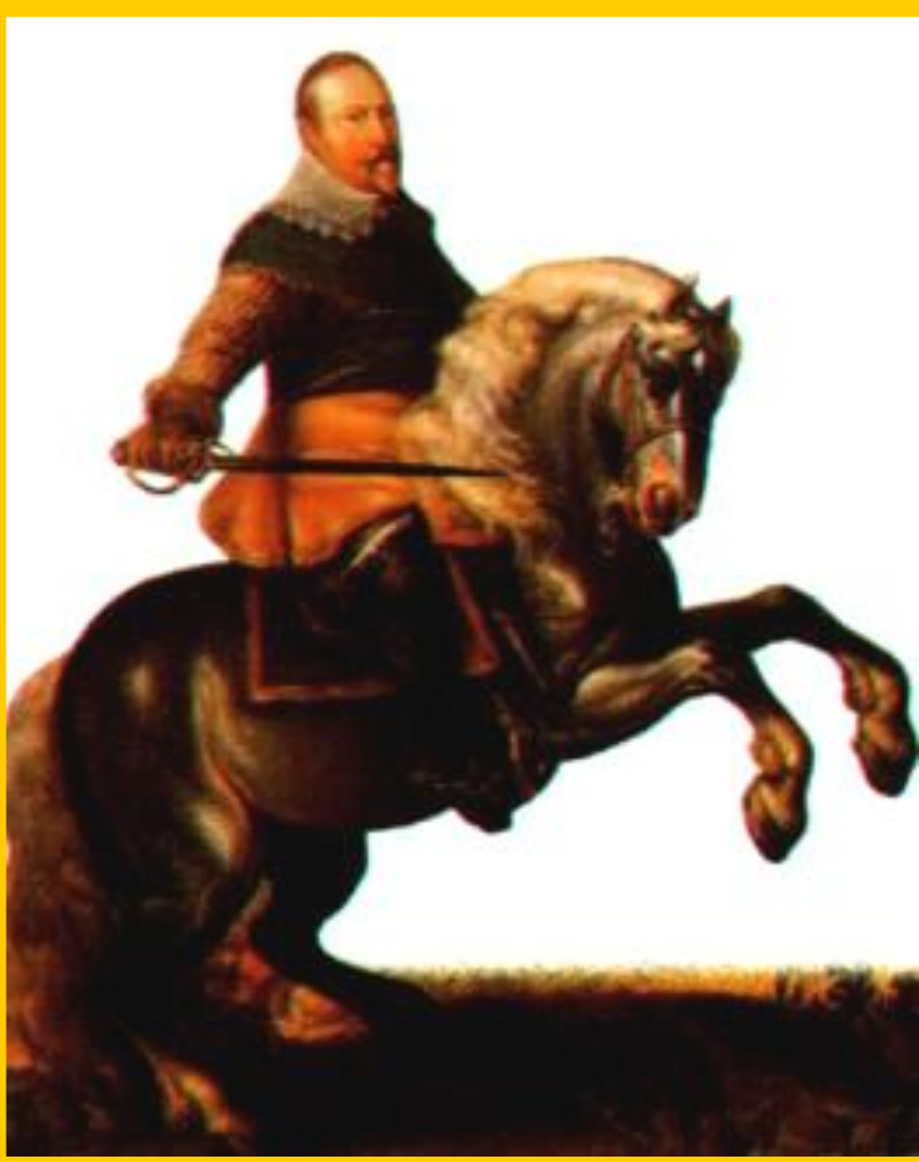
Шведский король Густав Адольф II.

В ответ вспыхнуло восстание. Королем был провозглашен Фридрих Пфальцский- ставленник протестантской лиги.