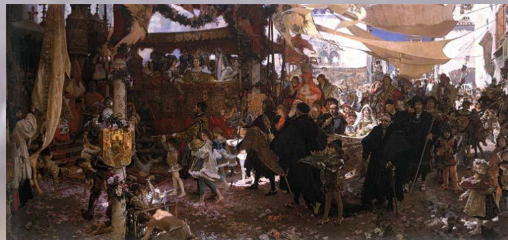
Франциско Прадилля «Крещение принца Хуана». 1910 г.