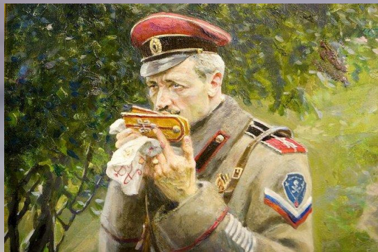
Павел Рыженко «Историческая живопись». 1970 г.