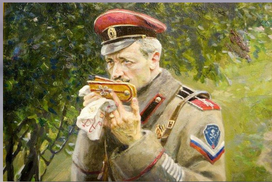
Павел Рыженко «Историческая живопись». 1970 г.