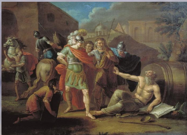
Корнелис де Вос «Александр и Диоген».

Историческая живопись — жанр живописи, берущий свое начало в эпоху Ренессанса и включающий в себя произведения не только на сюжеты реальных событий, но также мифологические, библейские и евангельские картины, изображает важные для отдельного народа или всего человечества события прошлого.