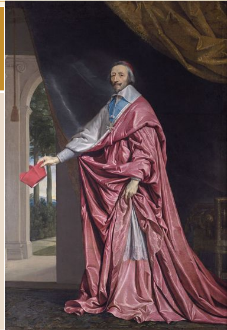
Филипп де Шампань «Большой парадный портрет короля Людовика XIII» (между 1622 и 1639)