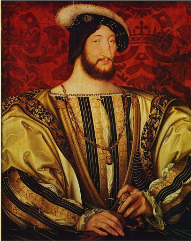
Жан Клуэ «Франциск I» (1525)