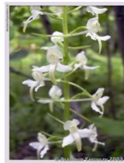
орхидея любка двулистная

Красная книга была учреждена Международным союзом охраны природы в 1966 году. Хранится она в швейцарском городе Морже. В неё заносятся все данные о растениях и животных, которые срочно нуждаются в опеке и защите.