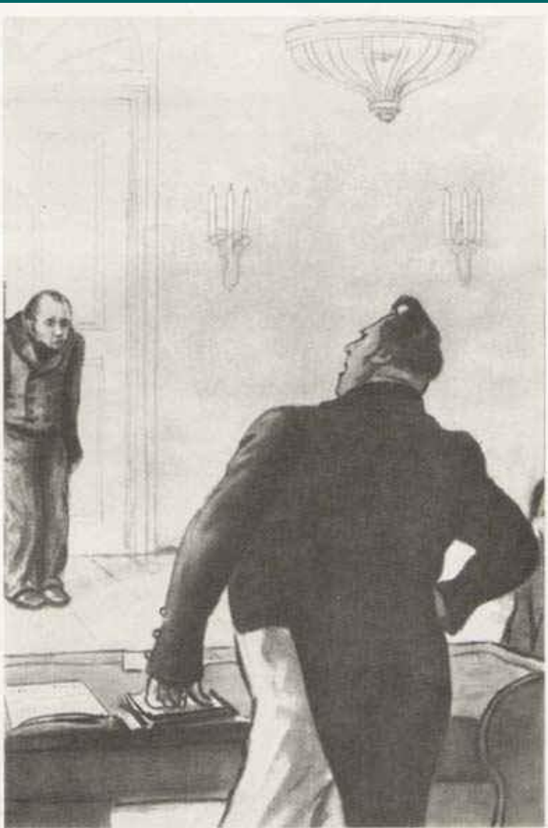
71. Акакий Акакиевич у значительного лица Художники Кукрыниксы, 1952 г., б., черная акварель