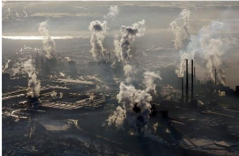
Рурский промышленный район

Версальская система – несправедливость: победители, побежденные.