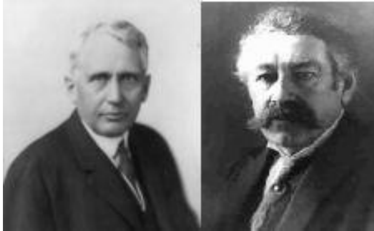
Авторы пакта Бриана-Келлога

2-я половина 1920-х гг. – «эра пацифизма». Не делать разницы между проигравшими и победителями.