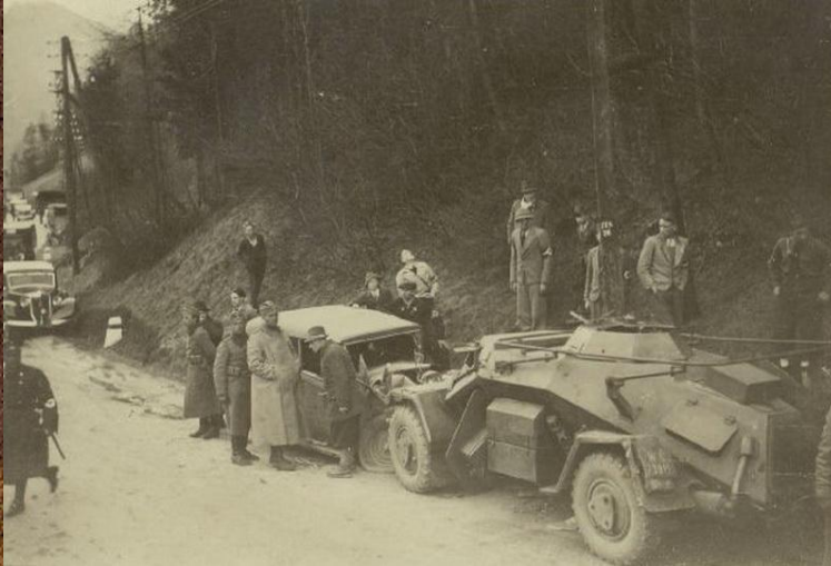
Немецкие войска в Австрии

1933 – Германия потребовала «равенства вооружений».