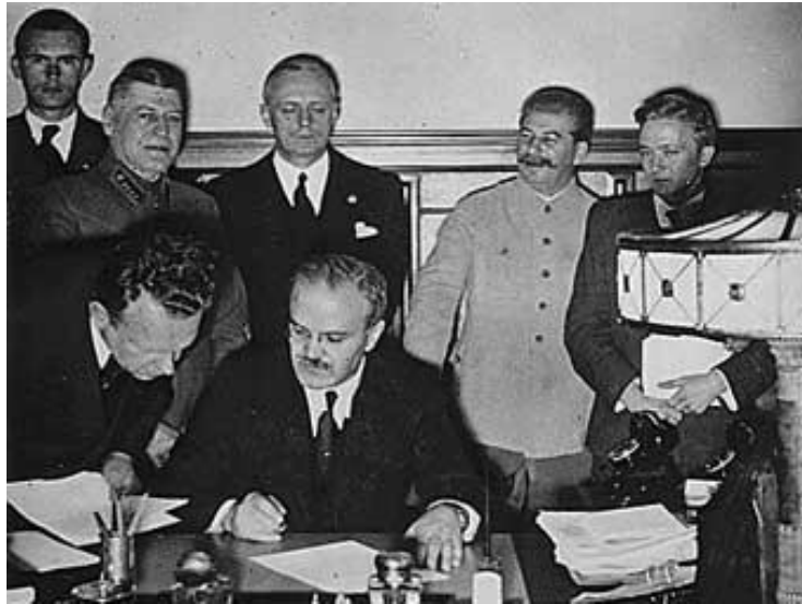
В. Молотов подписывает пакт о ненападении

3.1939 — Оккупация Чехословакии — протекторат Богемия и Моравия + Словацкое государство (фашизм)