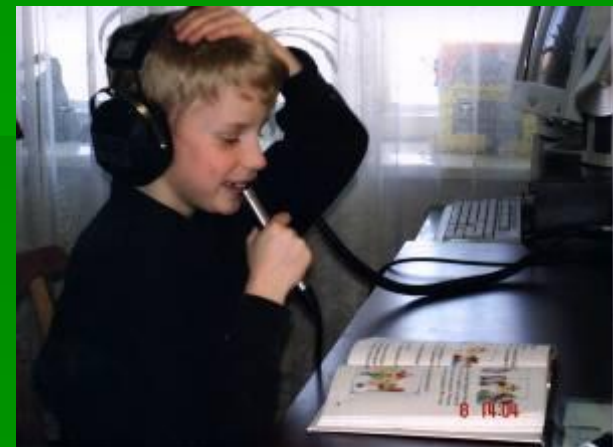
у звука [и] вибрация темени