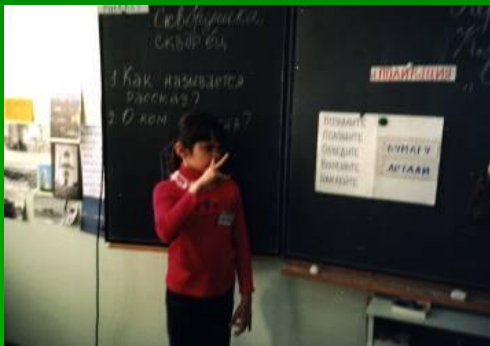
вибрация крыльев носа