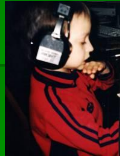
слабый теплый воздух у рта