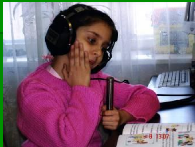
у звука [м] вибрация щек