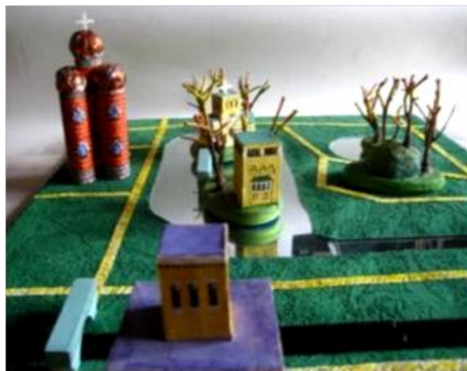
Макет исторического центра Петергофа