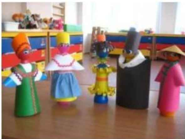
«Куклы в национальных костюмах» (кегли и цветная бумага)