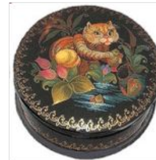
лаковая миниатюра «Палех»