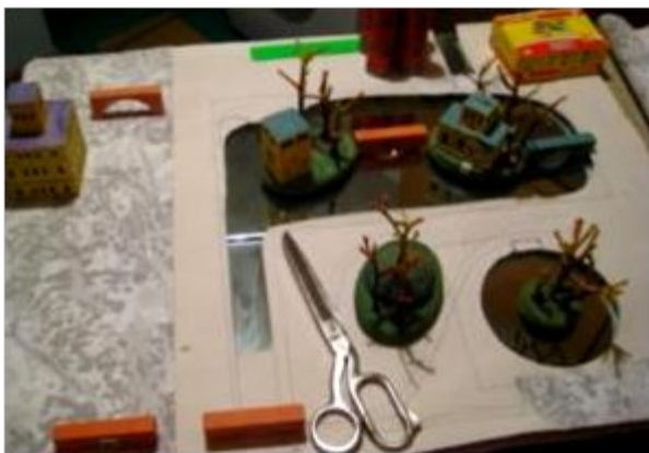
Разметка площади под Колонистский парк и Ольгин пруд.