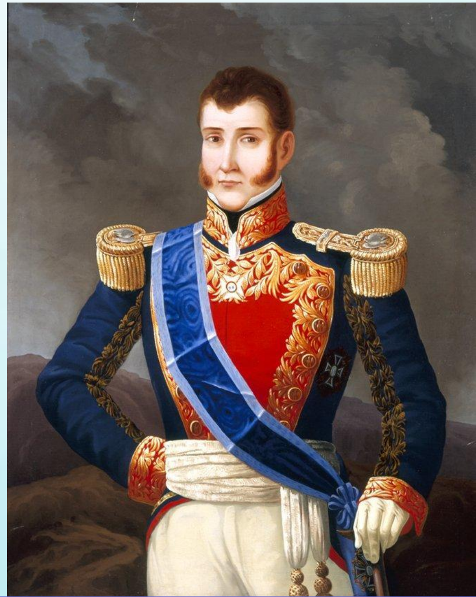
Августин де Итурбиде