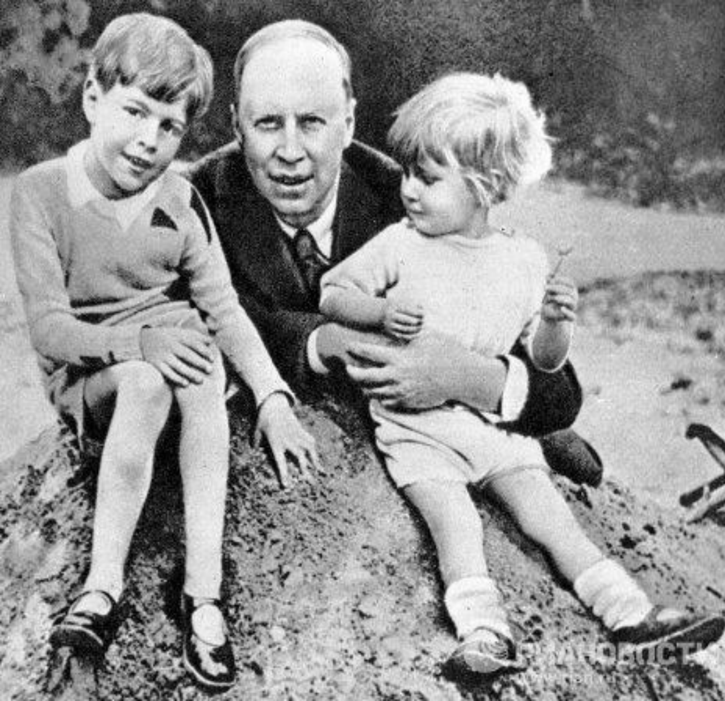
Сергей Прокофьев с сыновьями Святославом и Олегом