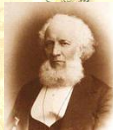
Петр Петрович Семенов 1827-1894

Исходя из этих сведений, можно ли назвать реформы 1860-1870-х гг. либеральными?