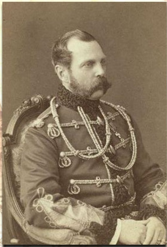
Александр II «Освободитель»

Почему в период реформ 1860-1870-х годов явные либеральные меры правительства сочетались с явными антилиберальными, консервативными?