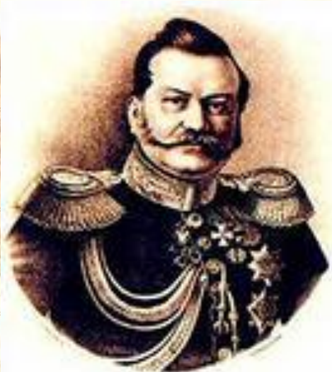
Яков Иванович Ростовцев 1803-1860

Авторов разработчиков крестьянской, судебной, военной и других реформ 1860-1870-х гг. (Я.И. Ростовцева, Н.А. Милютина, П.П. Семенова) их противники постоянно обвиняли в либерализме и называли «красными министрами»