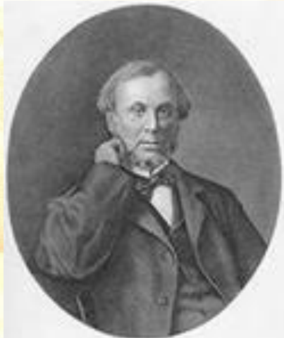
Николай Алексеевич Милютин 1818-1872