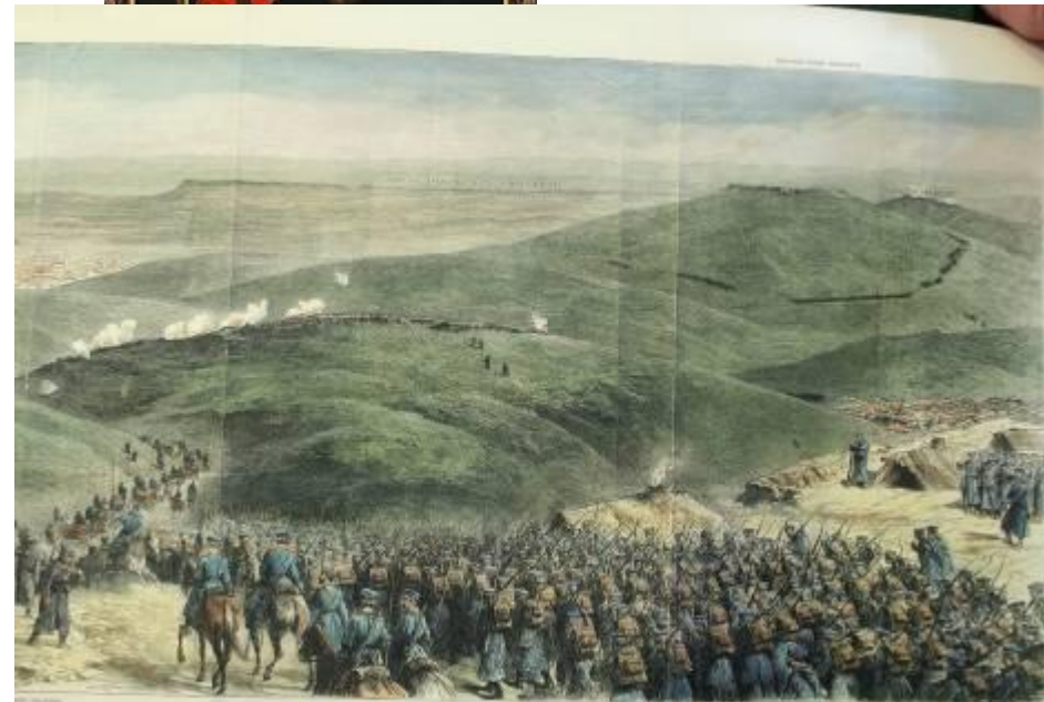
RUSSIAN AND TURKISH POSITIONS FROM THE SOUTH-EAST