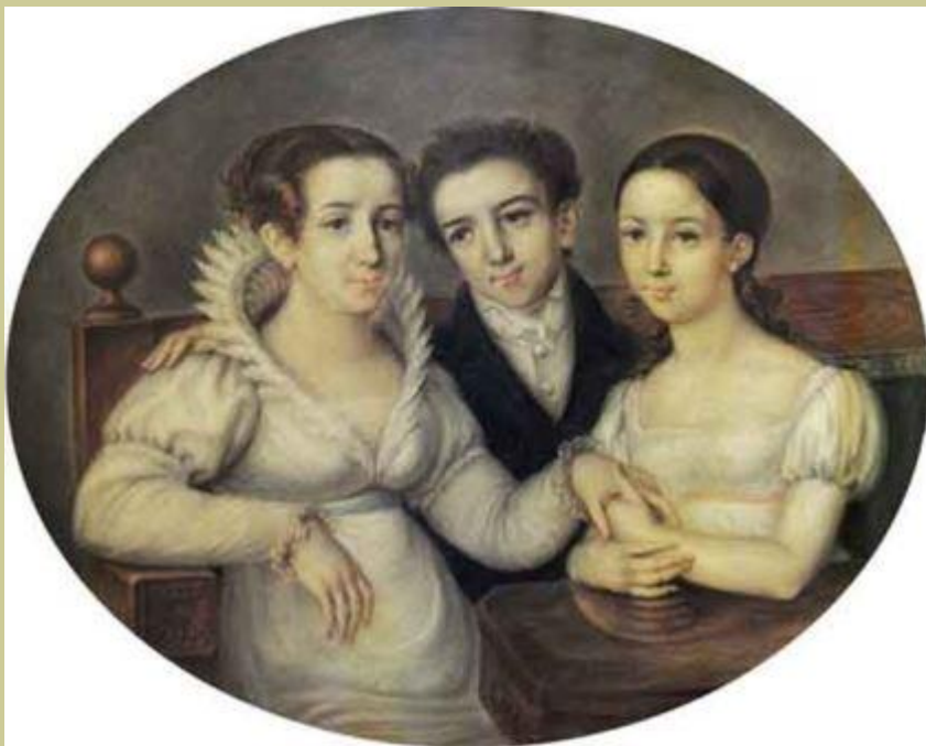
М. Глинка с матерью и сестрой

"Милая и бесценная маменька", "ангел-маменька", "ваше нежное родительское сердце", "что бы ни стало со мной, чувства сыновней к вам преданности ничто не изменит", "любовь к вам не допустит меня до отчаяния" - с такими словами обращался к матери Михаил Иванович Глинка в своих письмах. Евгения Андреевна всегда была для него духовной опорой и заботливой помощницей, а великий композитор всегда оставался для матери "деткой", которого нужно утешать и ободрять.