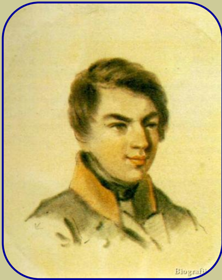
М.И. Глинка – выпускник Благородного пансиона в г. Петербурге

В 1817 году родители привозят Михаила в Санкт-Петербург и помещают в Благородный пансион при Главном педагогическом институте. Учился в пансионе Михаил хорошо, но самые очевидные способности демонстрировал как музыкант-исполнитель. С ним занимались лучшие педагоги, обучая главным образом игре на фортепиано. Среди них был пианист и композитор Шарль Майер .