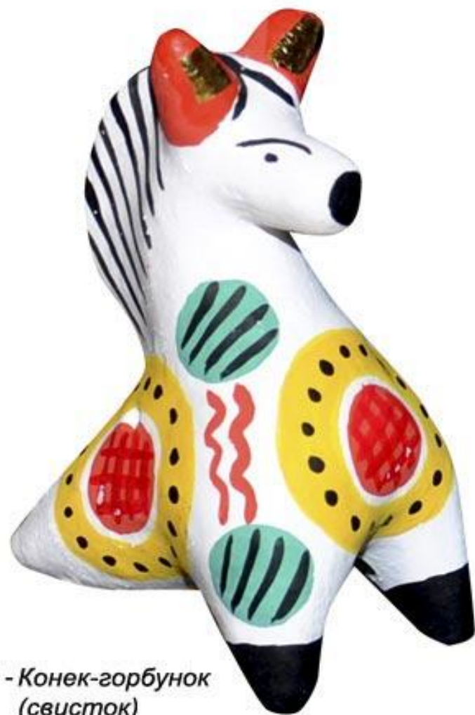
08 - Конек-горбунок (свисток)