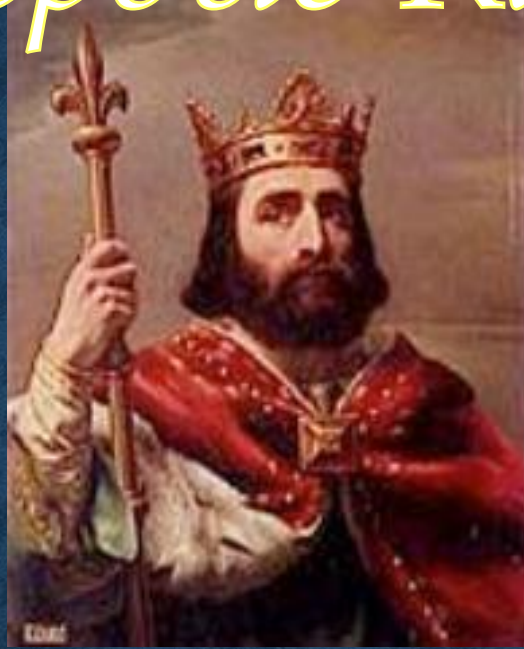
Пипин Короткий (741-768 гг.)

Основатель династии Каролингов, разгромил арабов при Пуатье в 732 г.