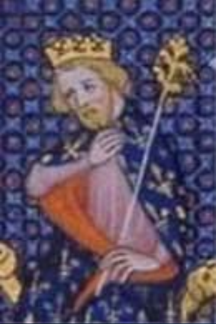
Карл Мартелл (715-741 гг.)