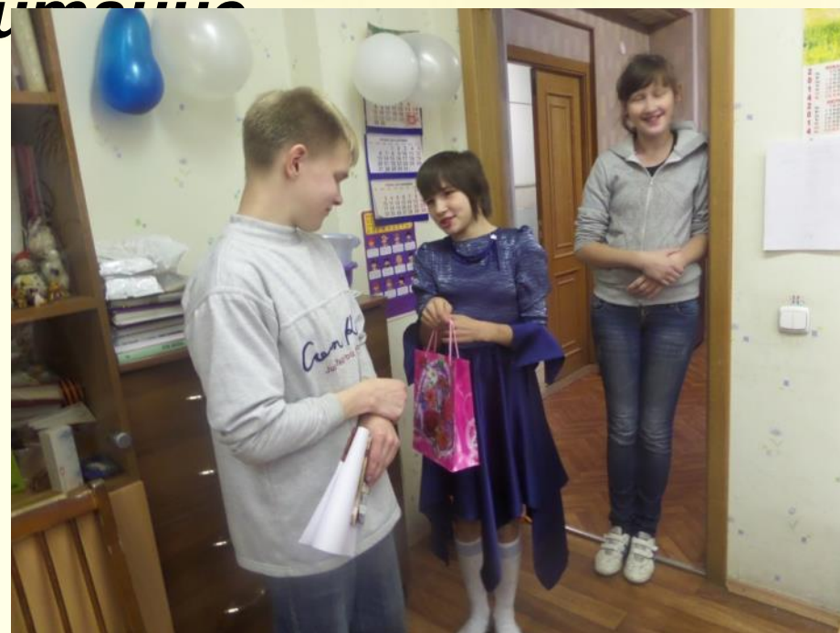
Празднование дней рождений