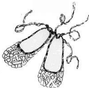
лапти с оборками