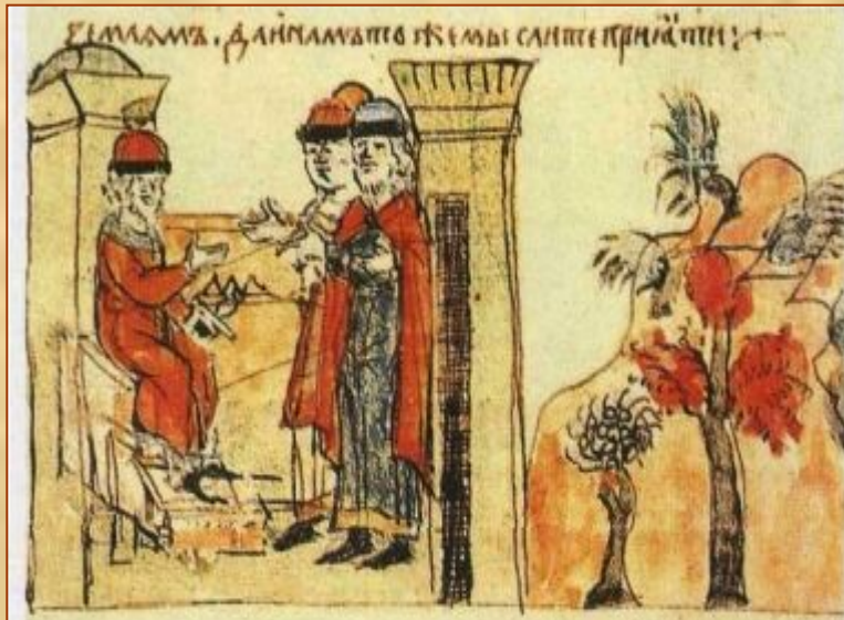
Изложение князю Владимиру своей веры хазарами