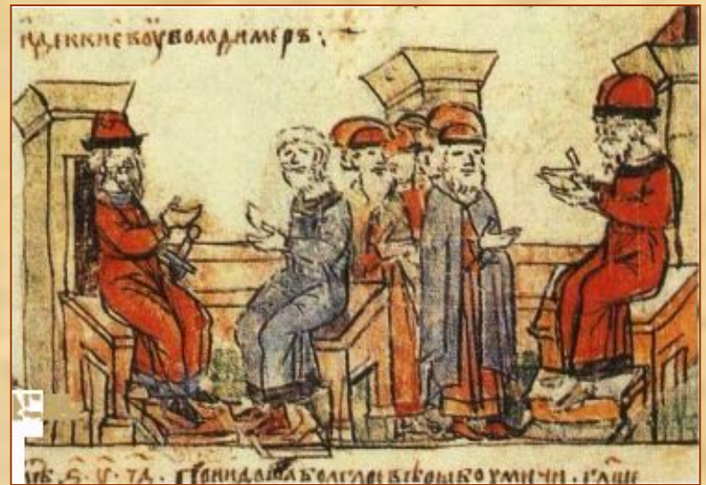
Изложение своей веры князю Владимиру мусульманами