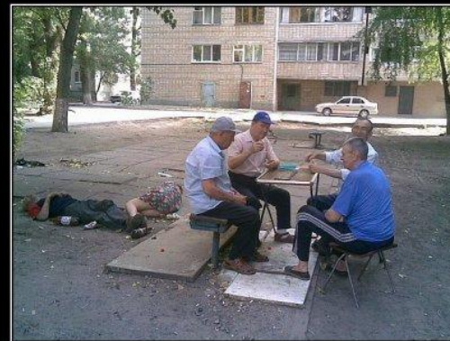
КУЛЬТУРНЫЕ ЛЮДИ культурно отдыхают