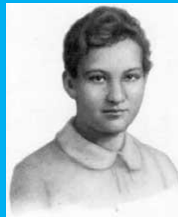
Зоя Космодемья нская