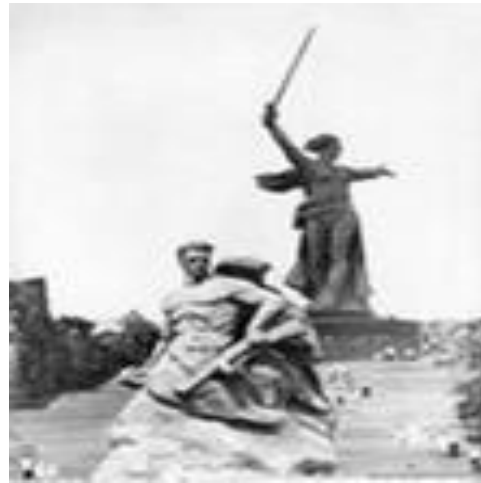
Памятник защитникам Сталинграда