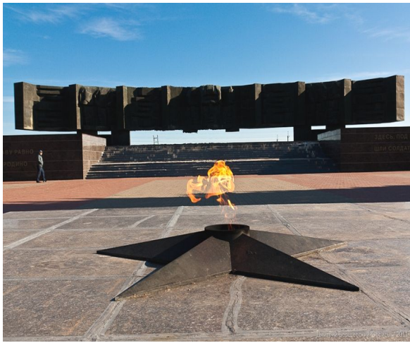
Мемориал в честь героев Курской битвы