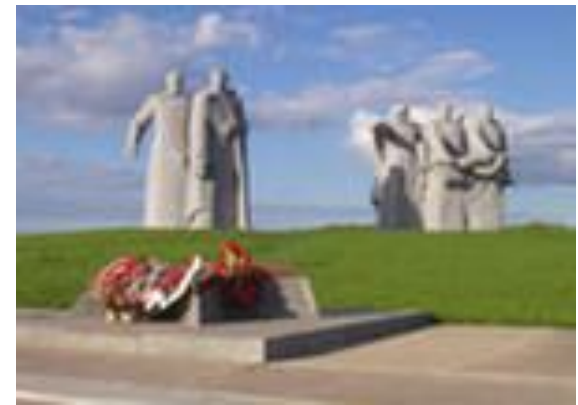
Мемориал в Подмосковье

Прогревели великие битвы: Московская, Сталинградская, на Курской дуге, 250 дней держал оборону героический Севастополь, 900 дней держал враг в блокаде мужественный Ленинград. Но наш народ выстоял, не сдался врагу, не покорился. В честь этого воздвигнуты мемориалы и памятники по всей стране.