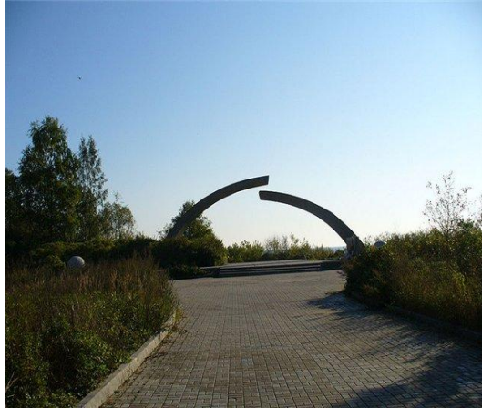
Мемориал «Разорванное кольцо» - защитникам блокадного Ленинграда