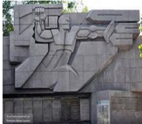
Мемориал героическим защитникам Севастополя

Прогревели великие битвы: Московская, Сталинградская, на Курской дуге, 250 дней держал оборону героический Севастополь, 900 дней держал враг в блокаде мужественный Ленинград. Но наш народ выстоял, не сдался врагу, не покорился. В честь этого воздвигнуты мемориалы и памятники по всей стране.