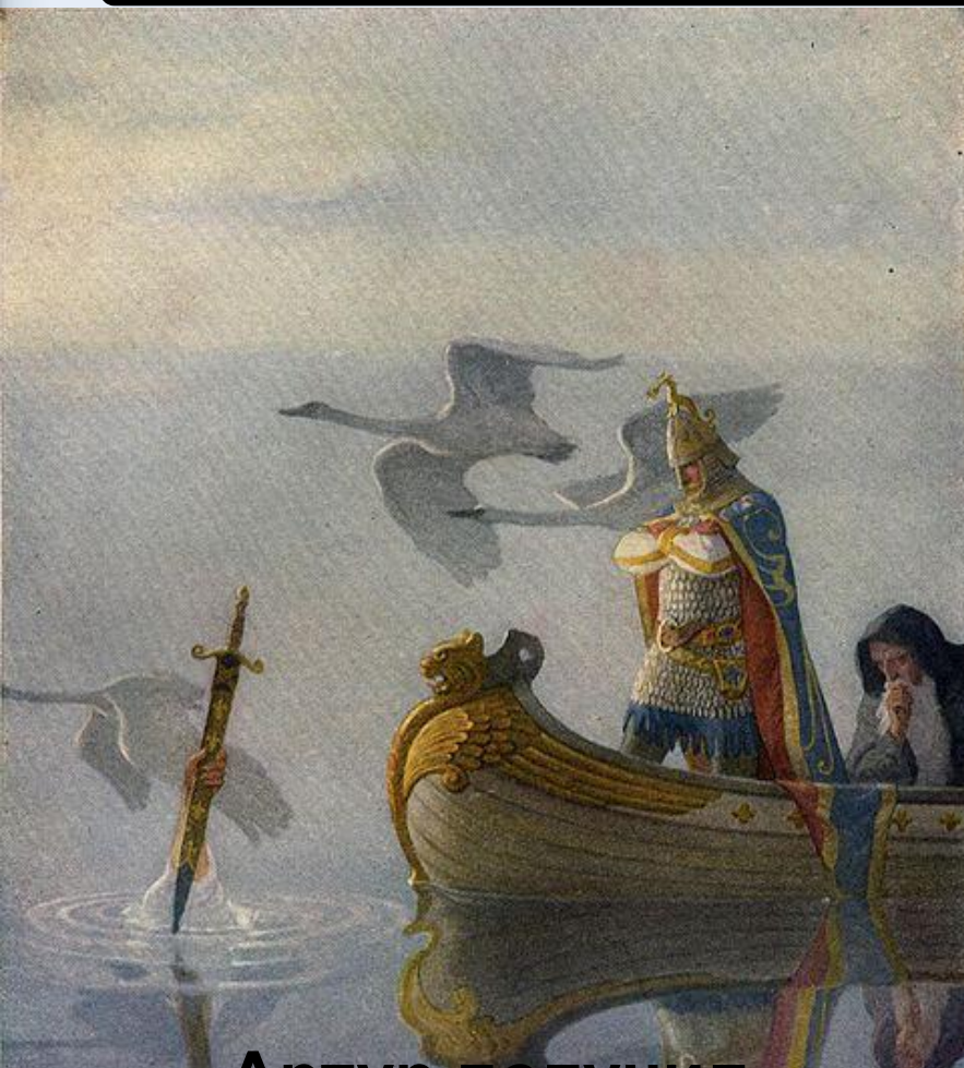
Артур получил Экскалибур от Девы Озера