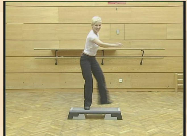
Упражнения для координации.