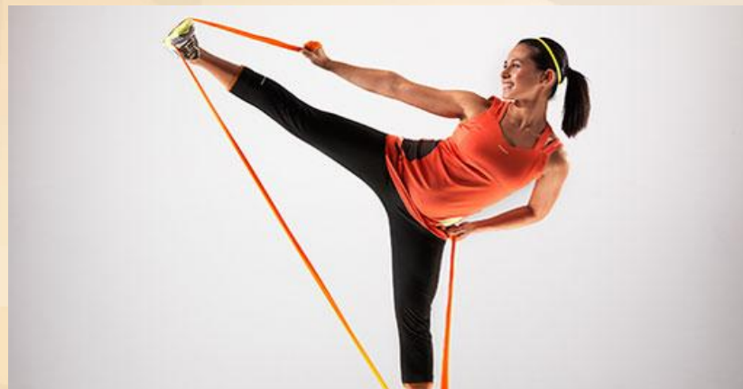
Упражнения для равновесия