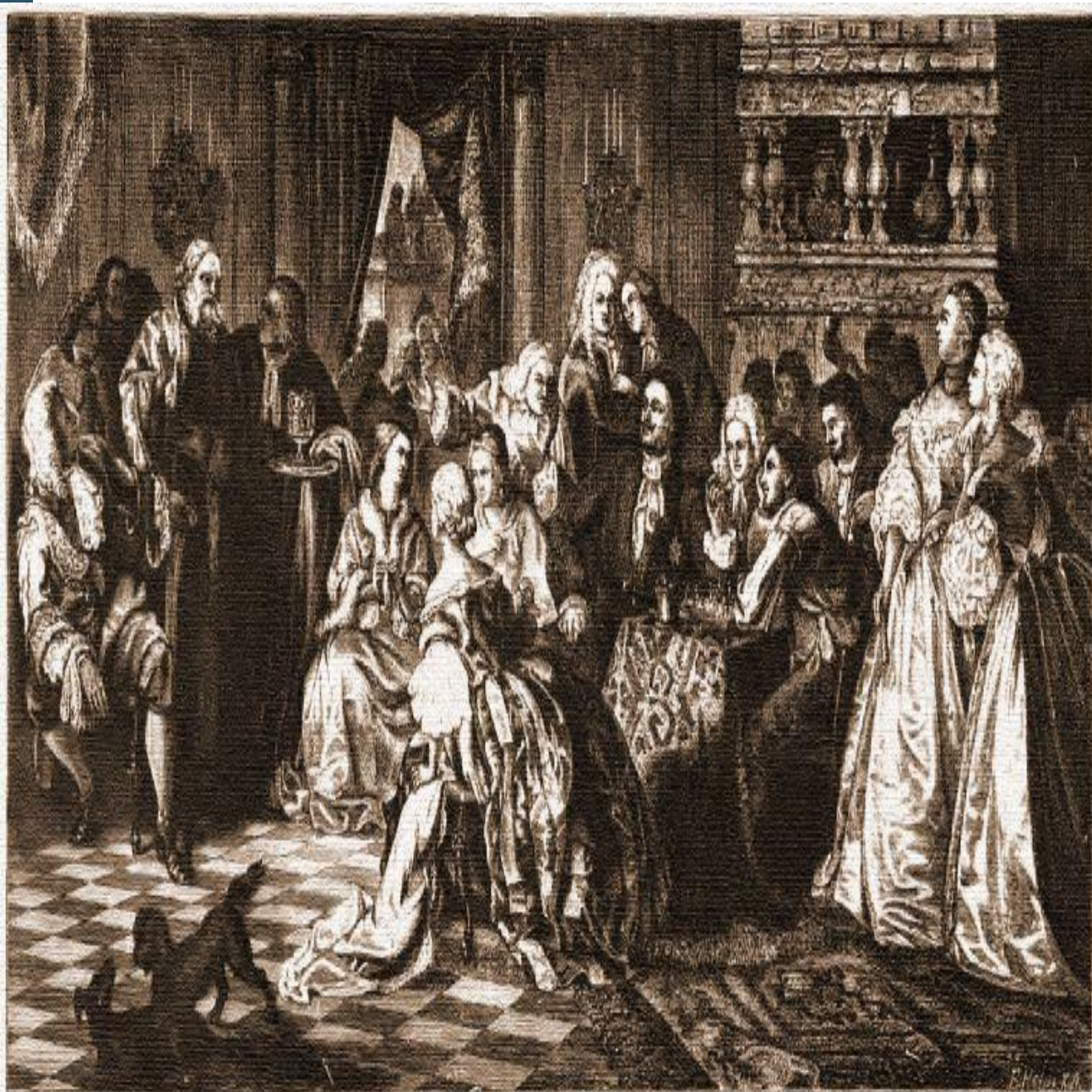
Ассамблея при Петръ Великомъ.

Картина профессора Хлѣбовскаго. Гравюра Хельма въ Штутгартѣ.