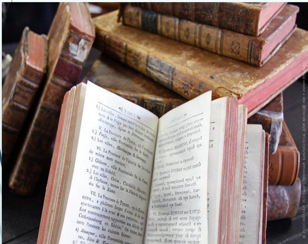
© РОСНИИКИ. ГОСУДАРСТВЕННАЯ БИБЛИОТЕКА ДЛЯ МОЛОДЕЖИ • WWW.RSL.RU